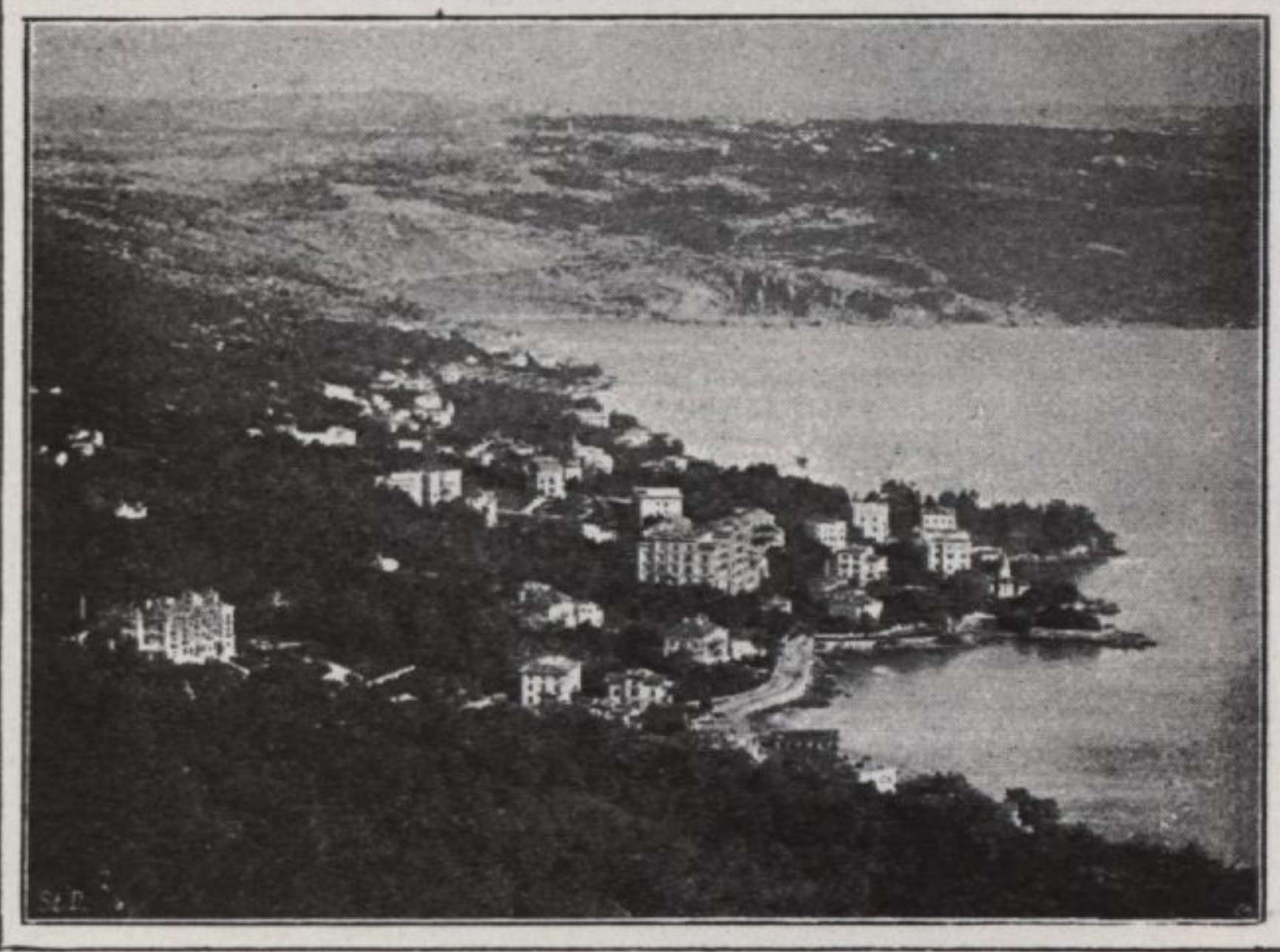
• ABBAZIA •