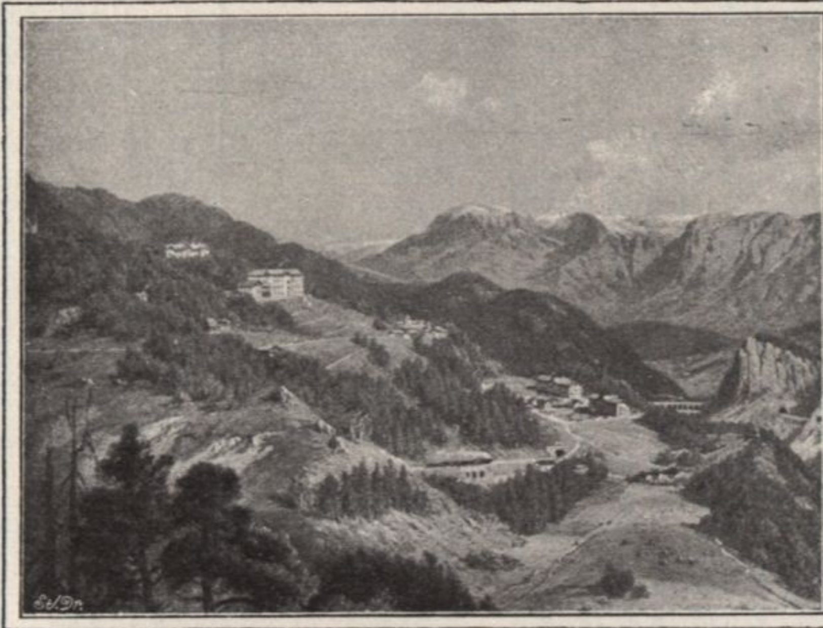
• SEMMERING •