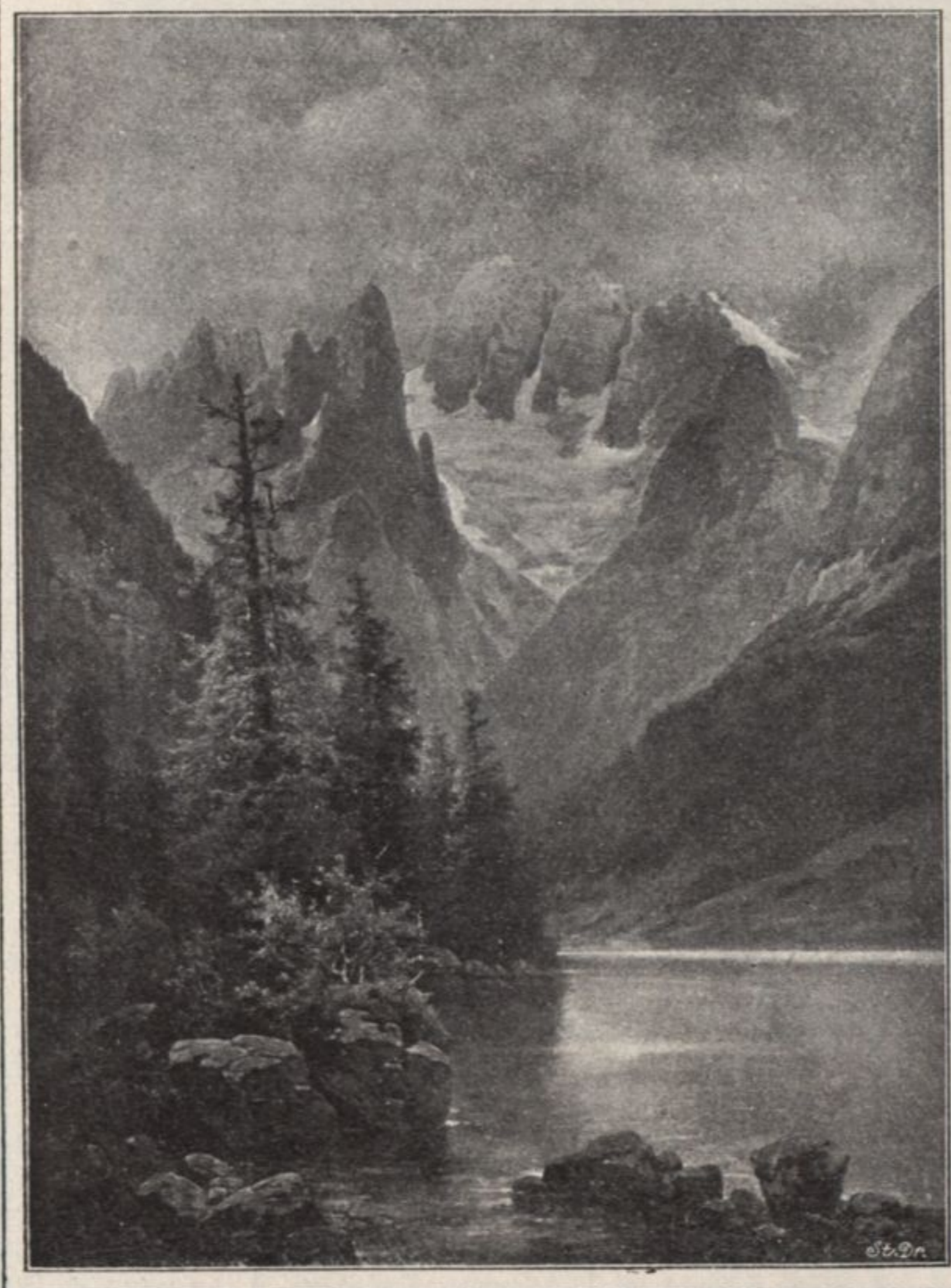
• M. CRISTALLO •