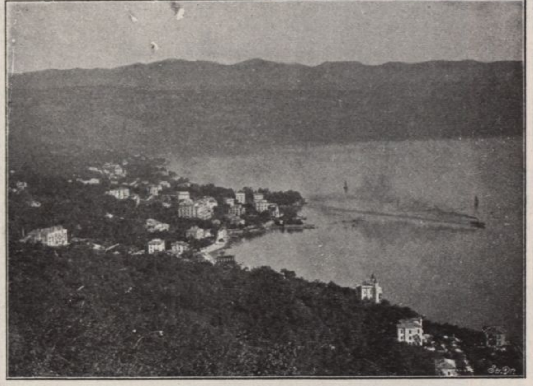
• ABBAZIA •