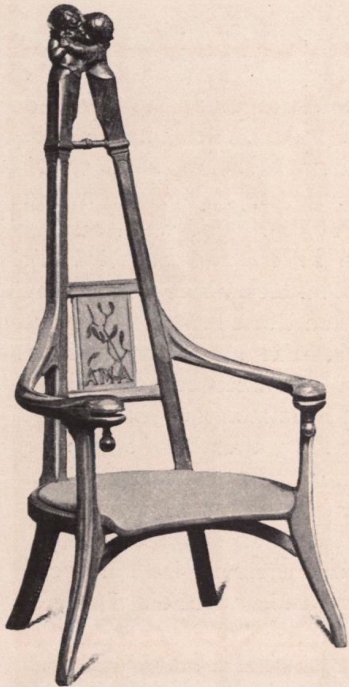
J. Dampt, Kindersessel, ausgeführt für die Enkel Victor Hugos

Gestalten halten sich bei den Händen, treten hervor und verschwinden wieder: sie sind das lächelnde und melancholische Gefolge der Stunden.