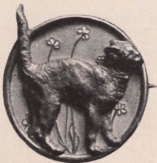
J. Dampt, Broche

schicklichkeit und die Kunststücke, die bei so vielen anderen Künstlern eher langweilig und ermüdend sind. Dampt weiss aus den einfachsten