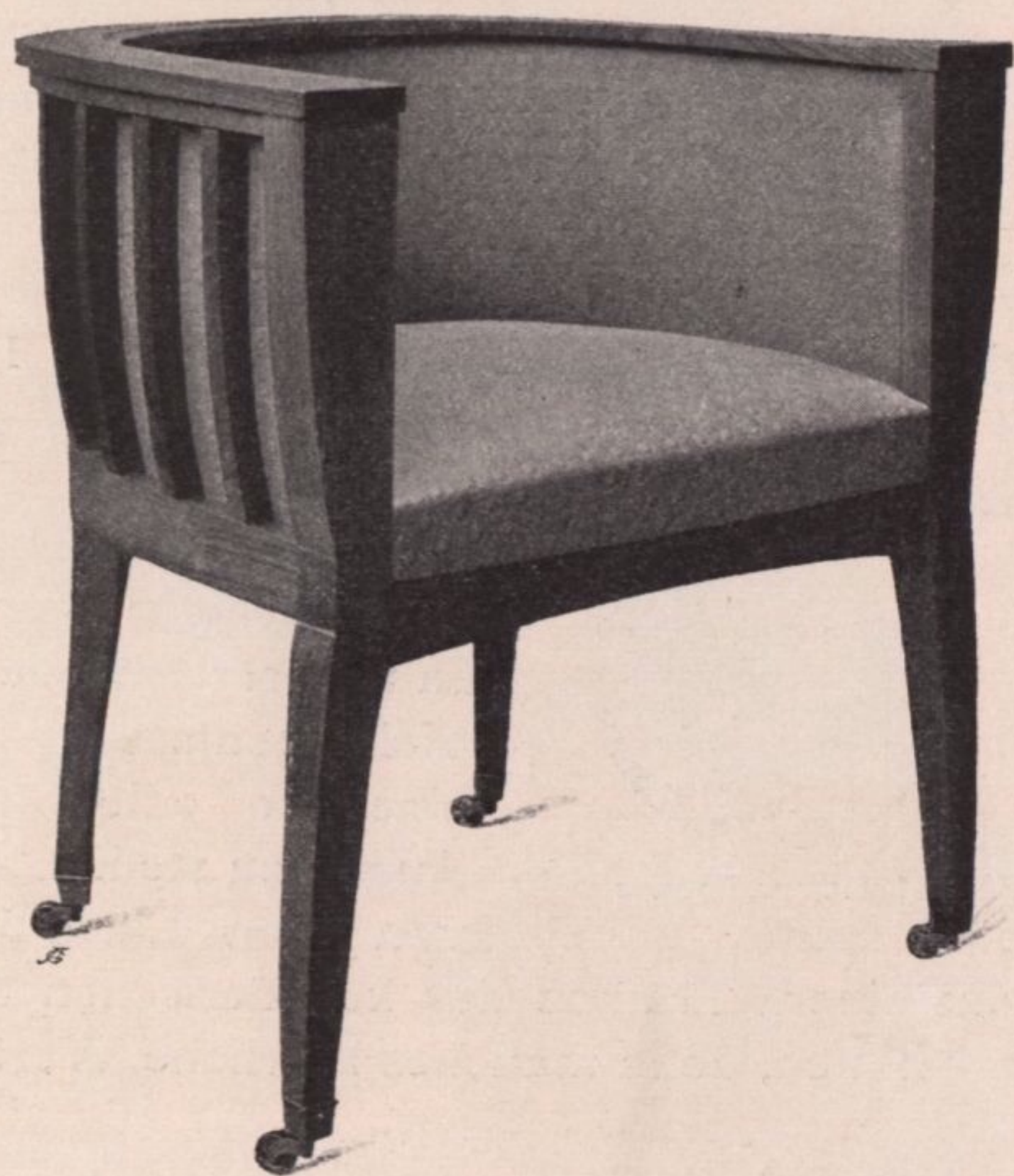
Schreibtischfauteuil, Kirschholz, von A. Pasternak und M. Geiringer

Die Zahl der zur Ausstellung gebrachten Interieurs ist bei weitem grösser als im vorigen Jahre, 24 gegen 15, und es ist wohl die allgemeine Stimmung, dass das Extravagante diesmal wohltuend zurückgetreten ist. Die Zeit der grellen und oft groben Effekthascherei ist vorüber, das Moderne wird zu meist nicht mehr in Übertreibungen der Formen und Farben, im Ungewöhnlichen und Auffallenden gesucht, auch Prunk und Pracht tritt zurück, und man trägt mehr dem Umstande Rechnung, dass es gilt, dem wohlhabenden Bürgertum, nicht den wenigen auserwählten Millionären zu zeigen, wie sie sich einrichten sollen. Man will wieder lehren und lernen, was Wohnungsbehaglichkeit sei, und darauf geht heute unser Aller Streben, es gehört zum Wesen der modernen Kunst, Räume zu