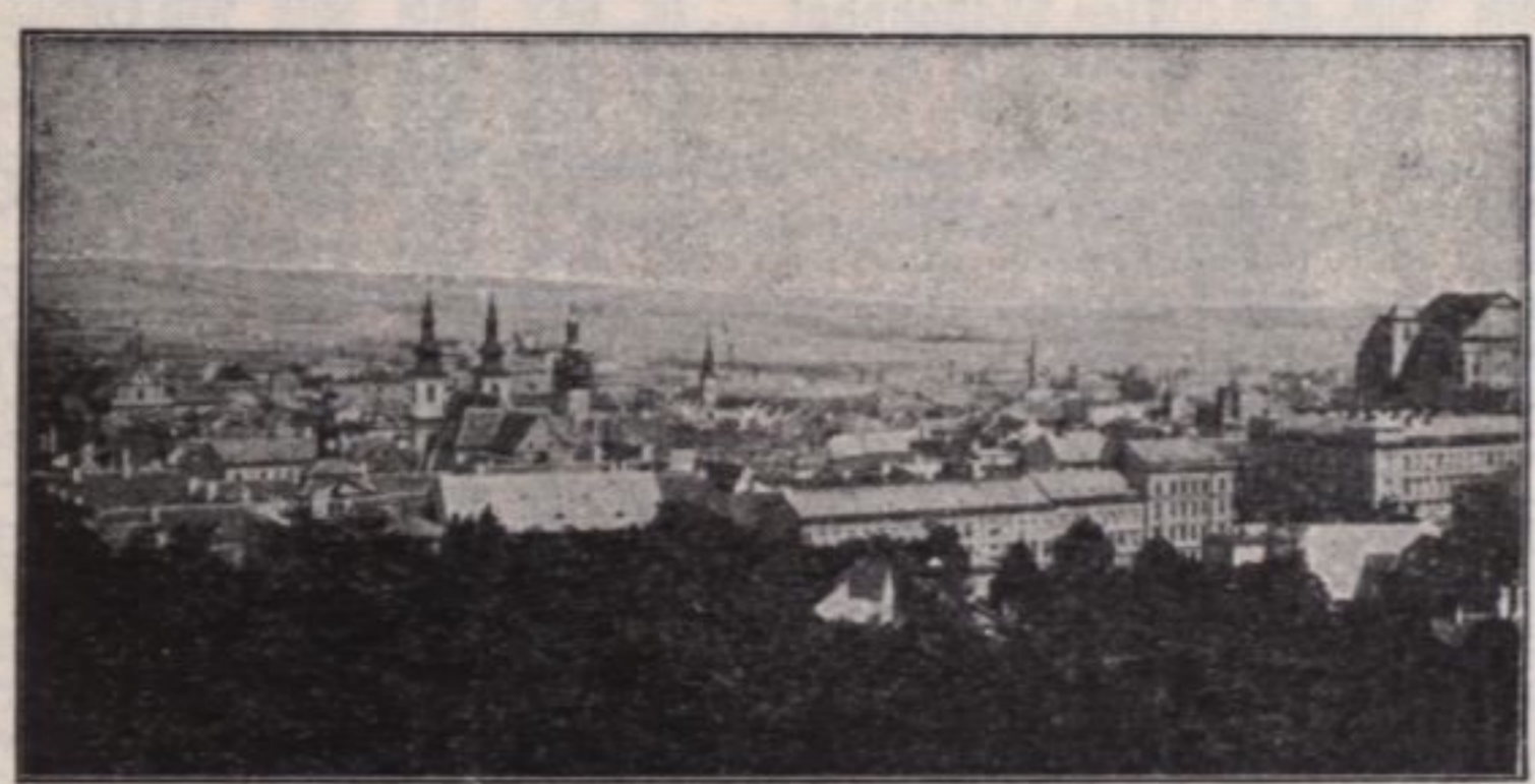
• TROPPAV •