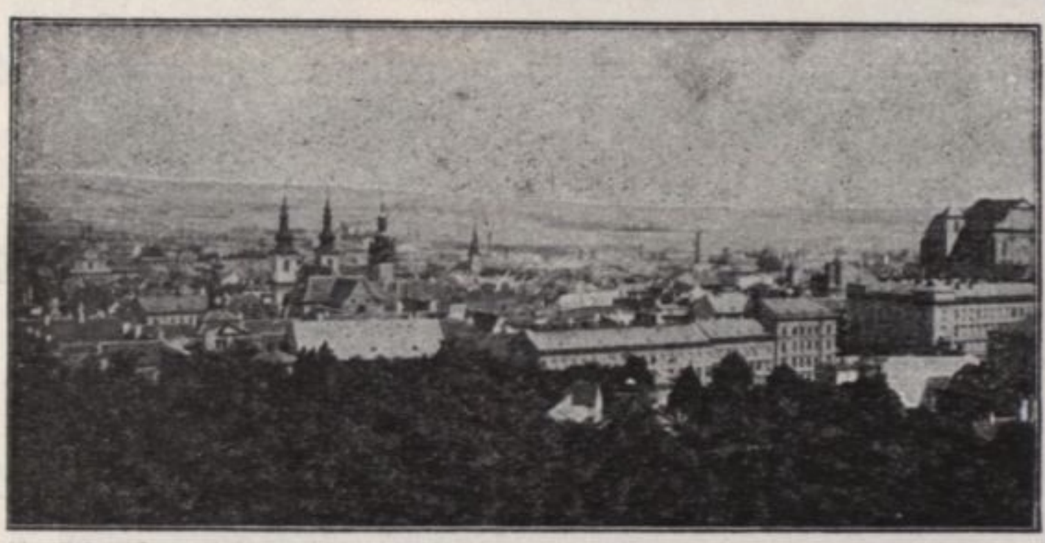
• TROPNAV •