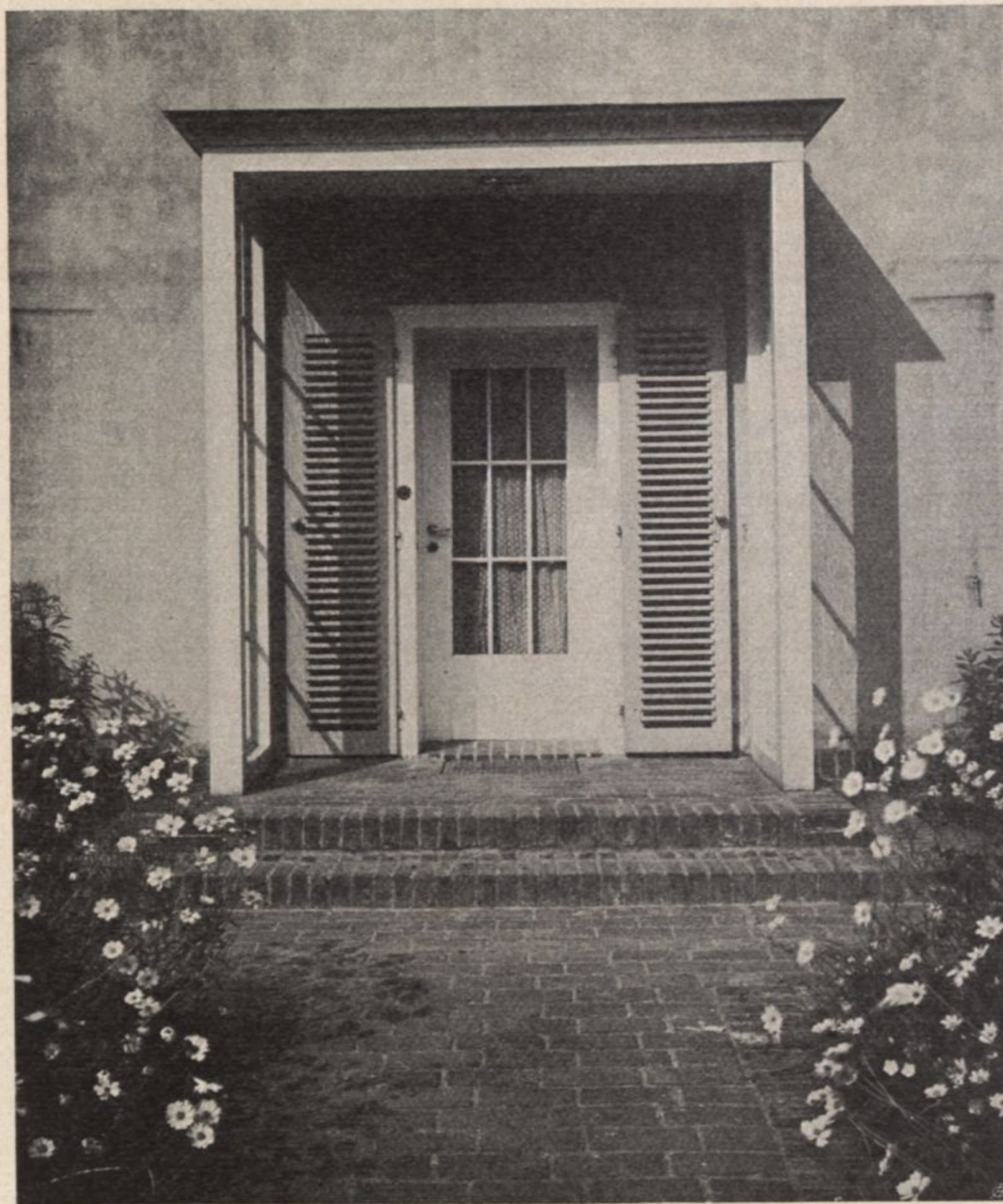
Heinrich Tessenow, Haustür eines Einfamilienhauses

Eigenschaften, von denen man den größten und heilsamsten Einfluß auf junge Menschen und werdende Architekten erhoffen möchte. Sieht man Tessenows Bauten oder seine bestrickend an-