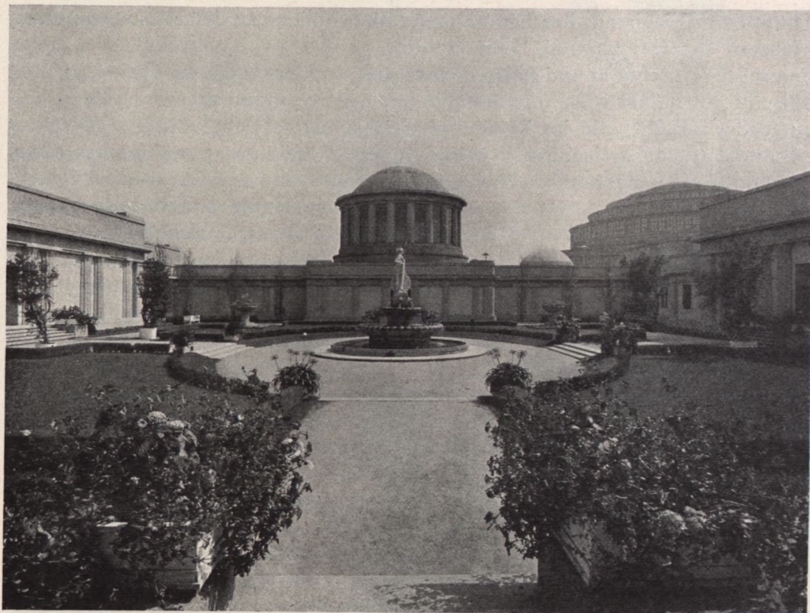
Ausstellung zur Jahrhundertfeier der Befreiungskriege. Gartenhof der historischen Ausstellung