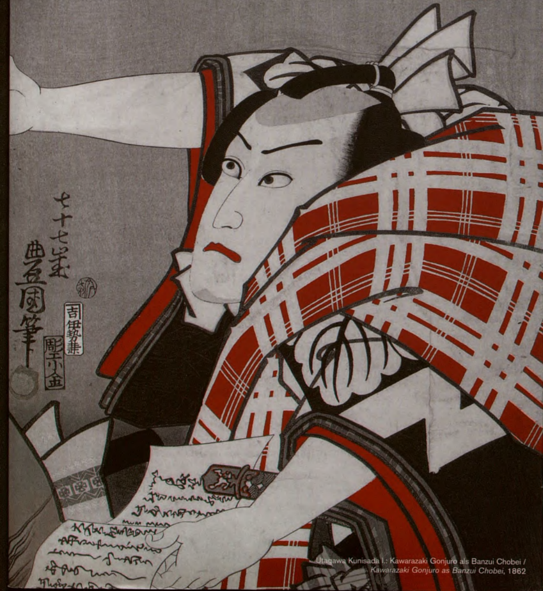
Utagawa Kunisada I.: Kawarazaki Gonjuro as Banzui Chobei / Kawarazaki Gonjuro as Banzui Chobei, 1862