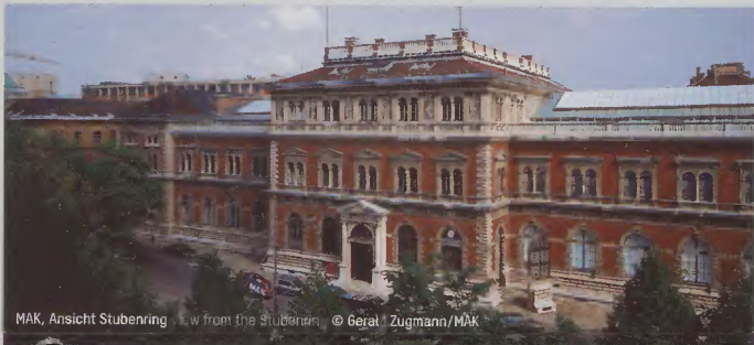
MAK, Ansicht Stubenring, View from the Stubenring