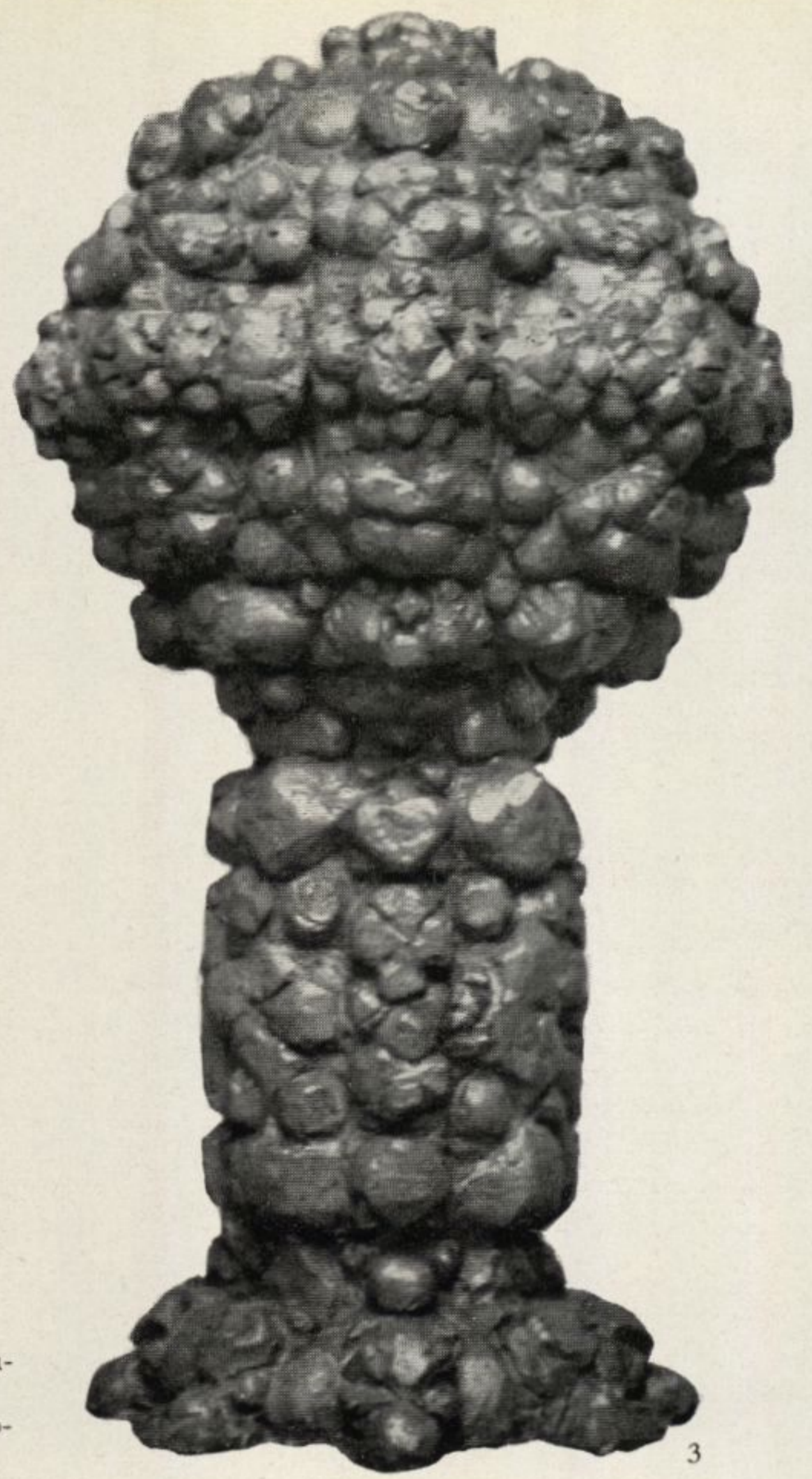
2 Fritz Hartlauer, Resultat aus der Kopfanalyse, 1954 3 Fritz Hartlauer, Analytische Gesamtdisposition „7“, Bronze-guß 30 cm H, 1956