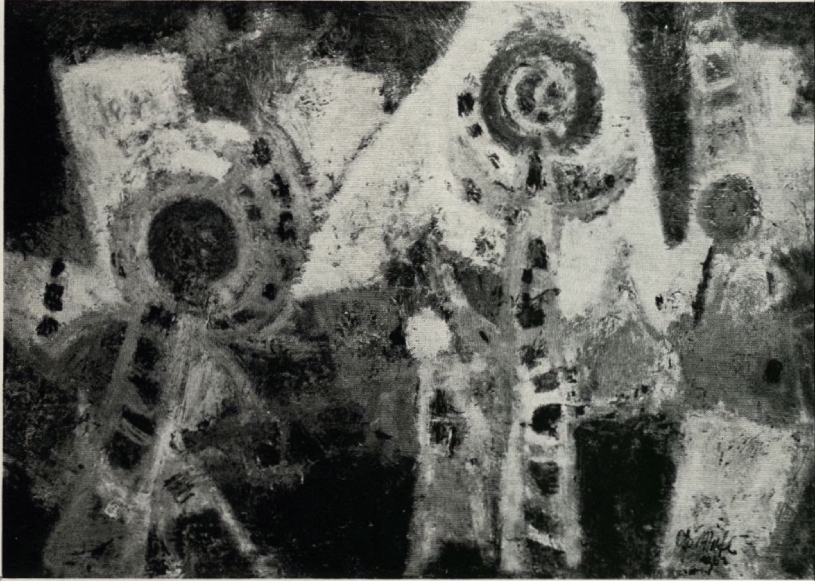
8 Malklasse Prof. Dimmel, Otto Mirtl, Figuren, Öl, 78 x 115 cm