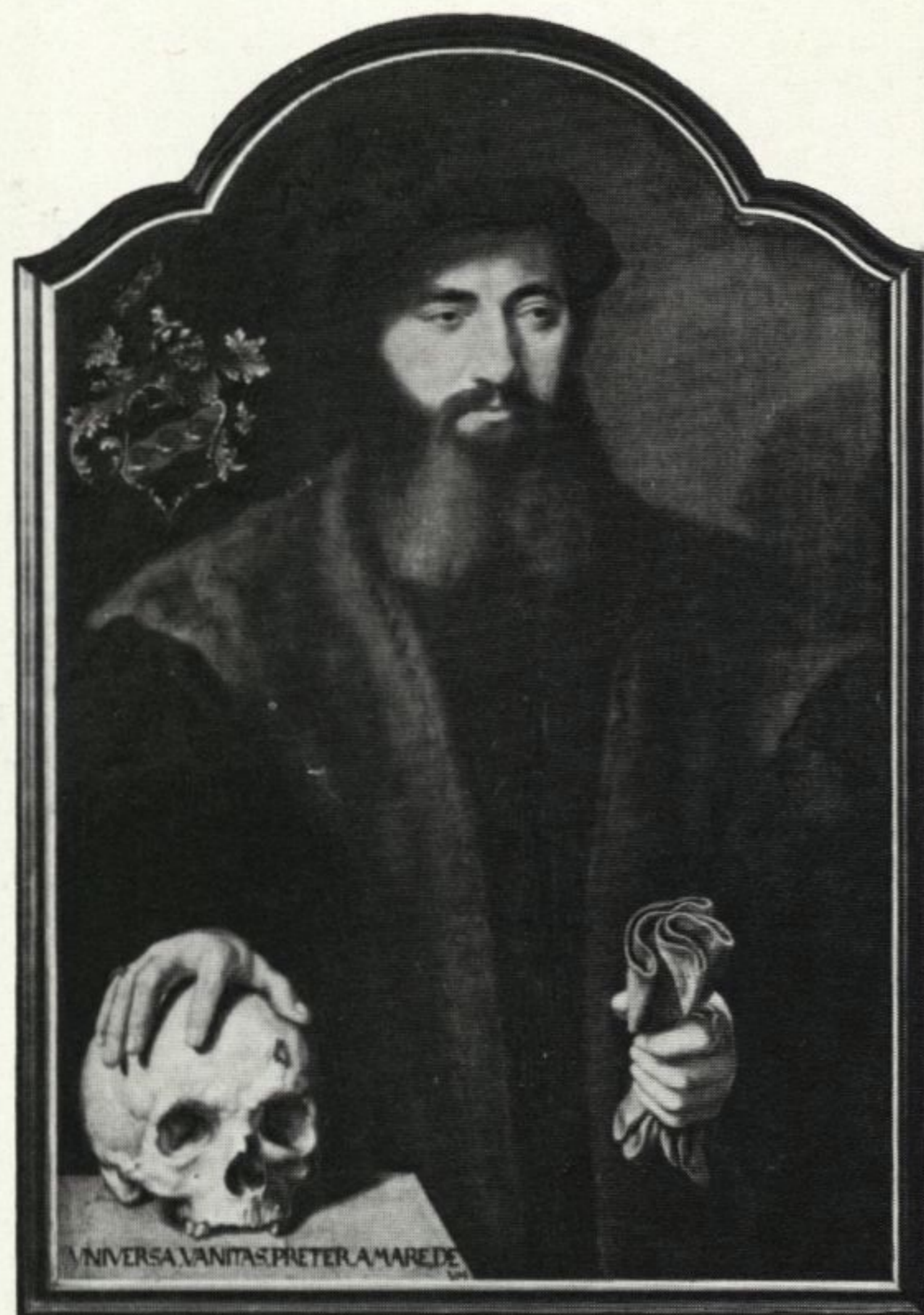
Barthel Bruyn Bildnis des Ratsherrn J. van Ryndorp Öl auf Holz, 82 x 57 cm Aus der 527. Lempertz-Auktion am 15. Nov.

527. LEMPERTZ-AUKTION ALTE KUNST 15. bis 17. November Gemälde · Skulpturen Kunstgewerbe