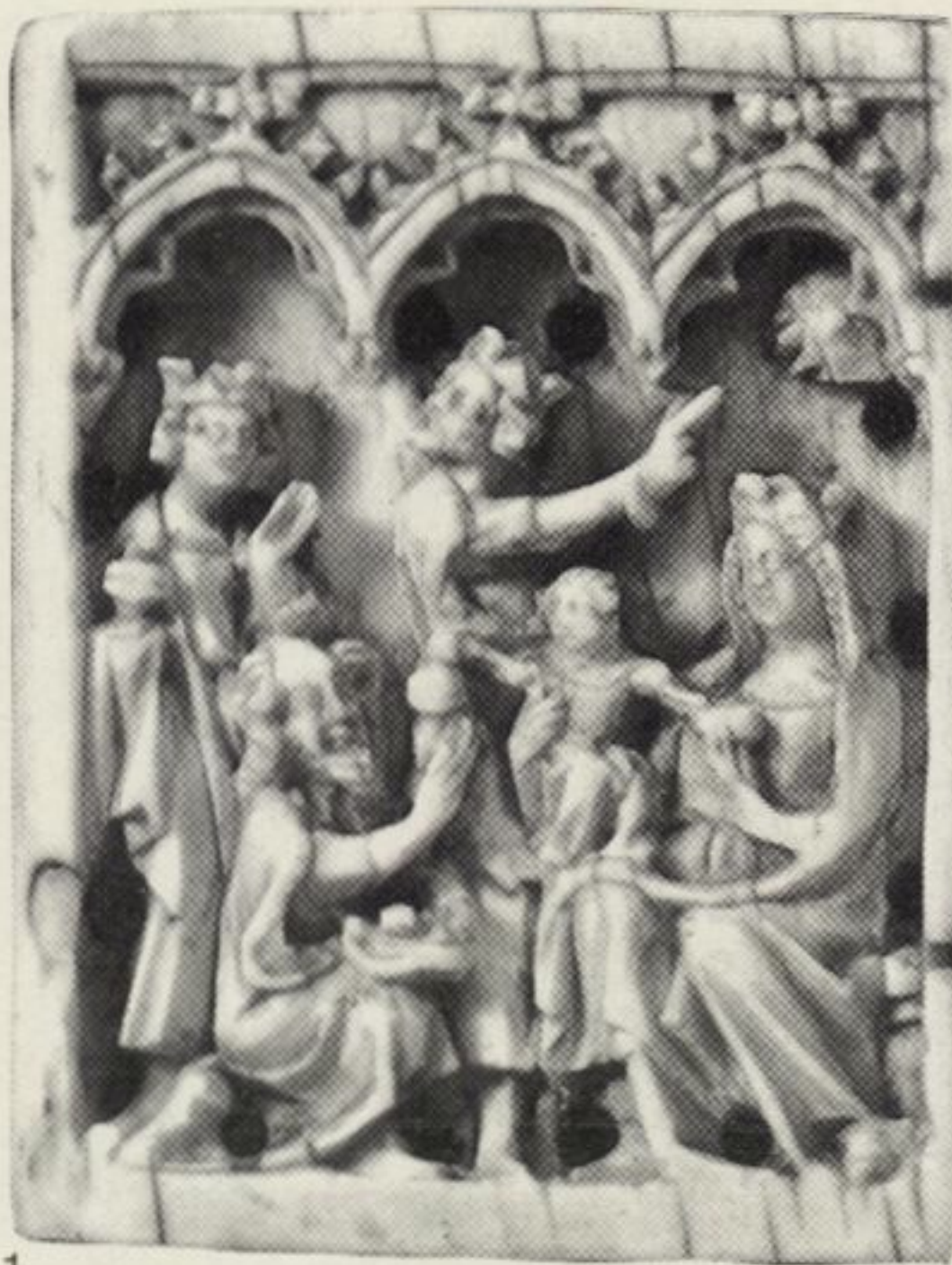
1 HERBERT ASENBAUM, ANTIQUITÄTEN A-1010 WIEN 1, KÄRNTNER STRASSE 28 Elfenbeinplatte aus einem Reisealtar Deutsch, 2. Hälfte 14. Jahrhundert Maße: 6,6 x 5 cm (fast orig. groß abgebildet)