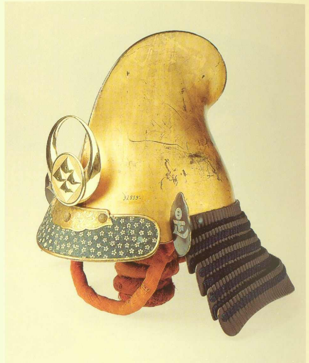
111 Helm naga, eboshi kabuto Mit Familienwappen sumitate-yotsume (Über Eck gestellte vier Augen) Edo-Periode, 18.-19. Jh. Eisen, Messing, Blattgold, Leder, Textil, Höhe 37 cm MVK – Museum für Völkerkunde, Wien, 32535