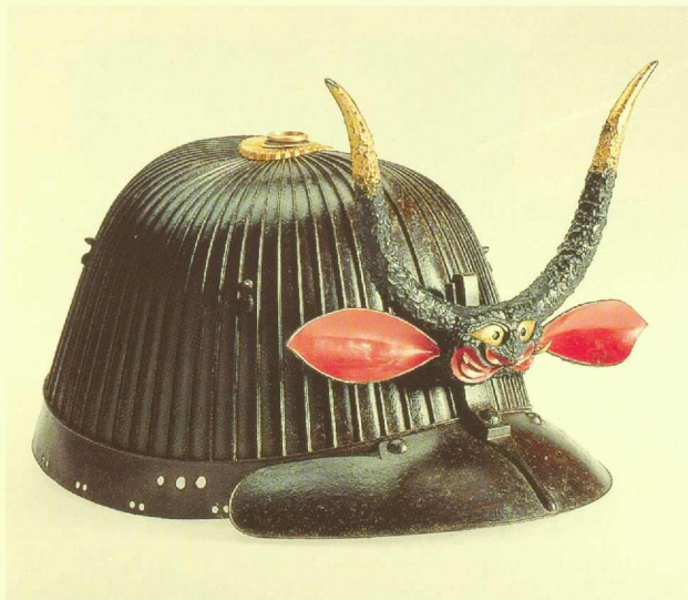
112 Saotome Iyetada Helm hachi Momoyama-Periode, letztes Viertel 16. Jh. Eisen, feuervergoldete Kupferlegierung, Lack rot und schwarz auf Holz, Leder, Eisen, Höhe 16 cm Signatur auf der Innenseite MVK – Museum für Völkerkunde, Wien, 32533