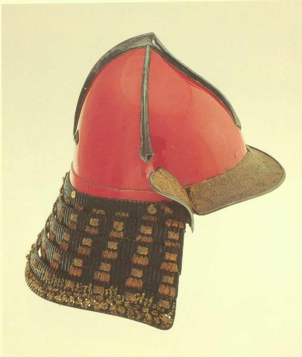
110 Helm eboshi kabuto Edo-Periode, 18. Jh. Lack auf Eisen, Leder, Goldlack, Textil, Höhe 32 cm MVK – Museum für Völkerkunde, Wien, 32532