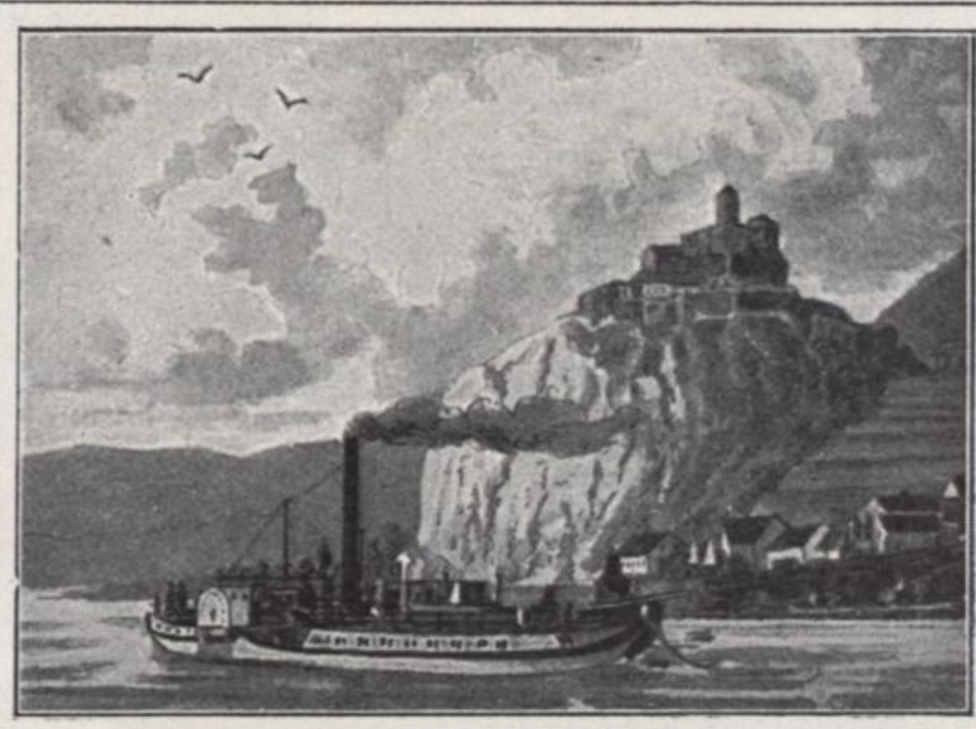
SCHRECKENSTEIN A/D ELBE