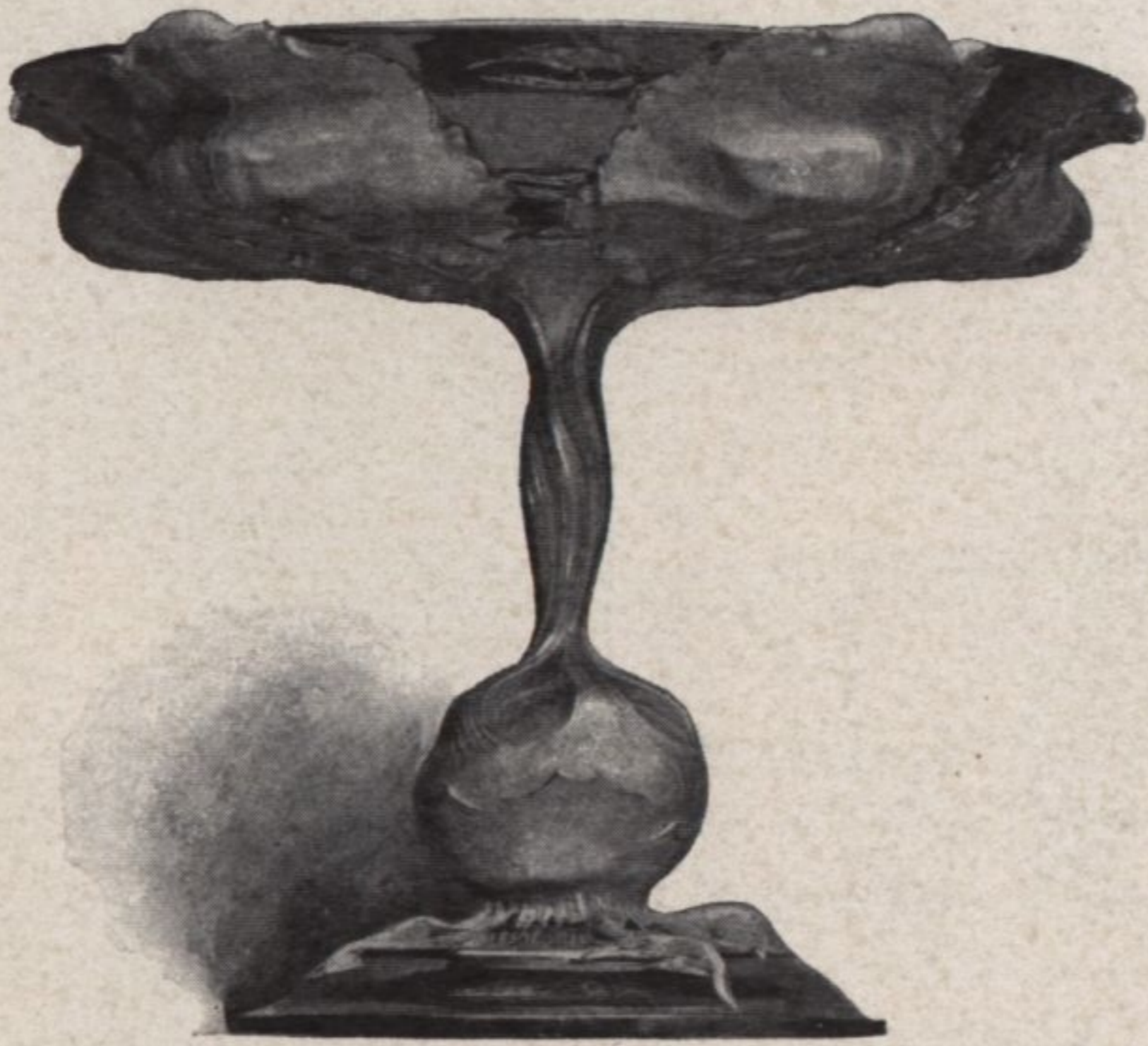
R. Hammel, Confectschale, in Silber ausgeführt von V. Mayer's Söhne