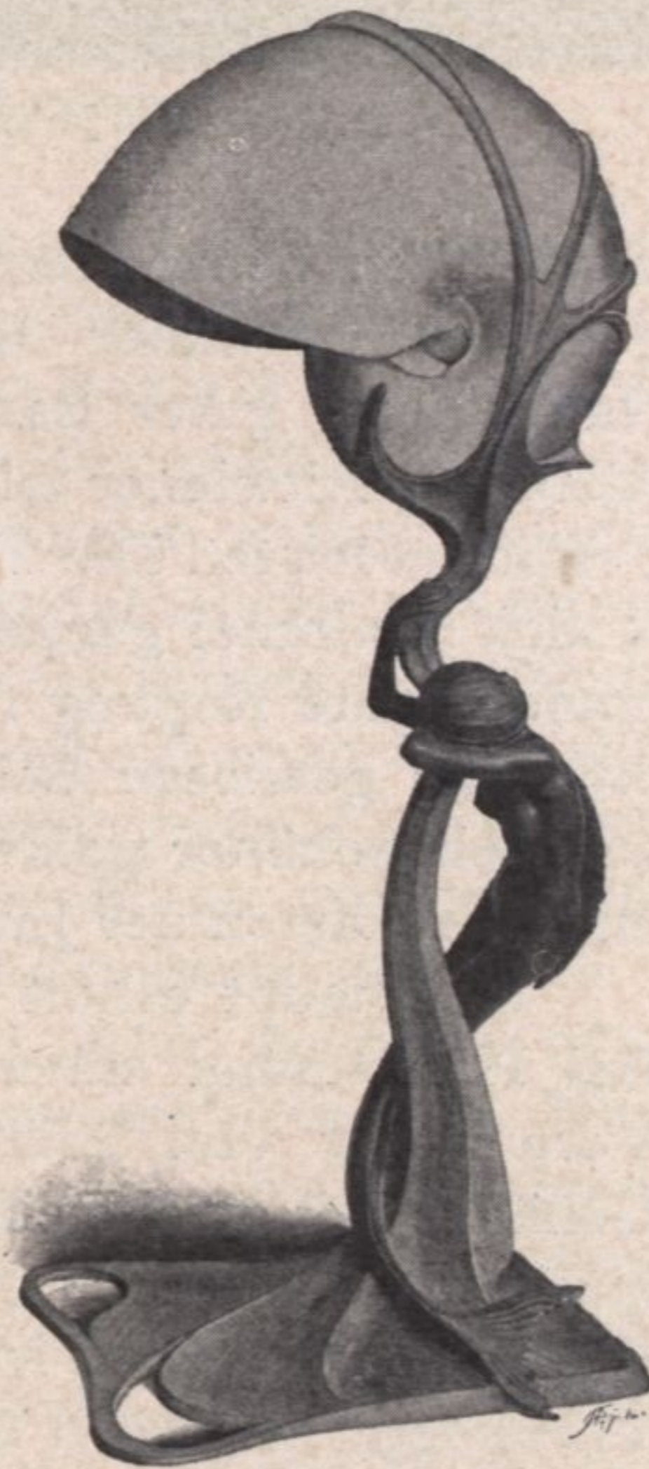
G. Gurschner, Elektrische Lampe