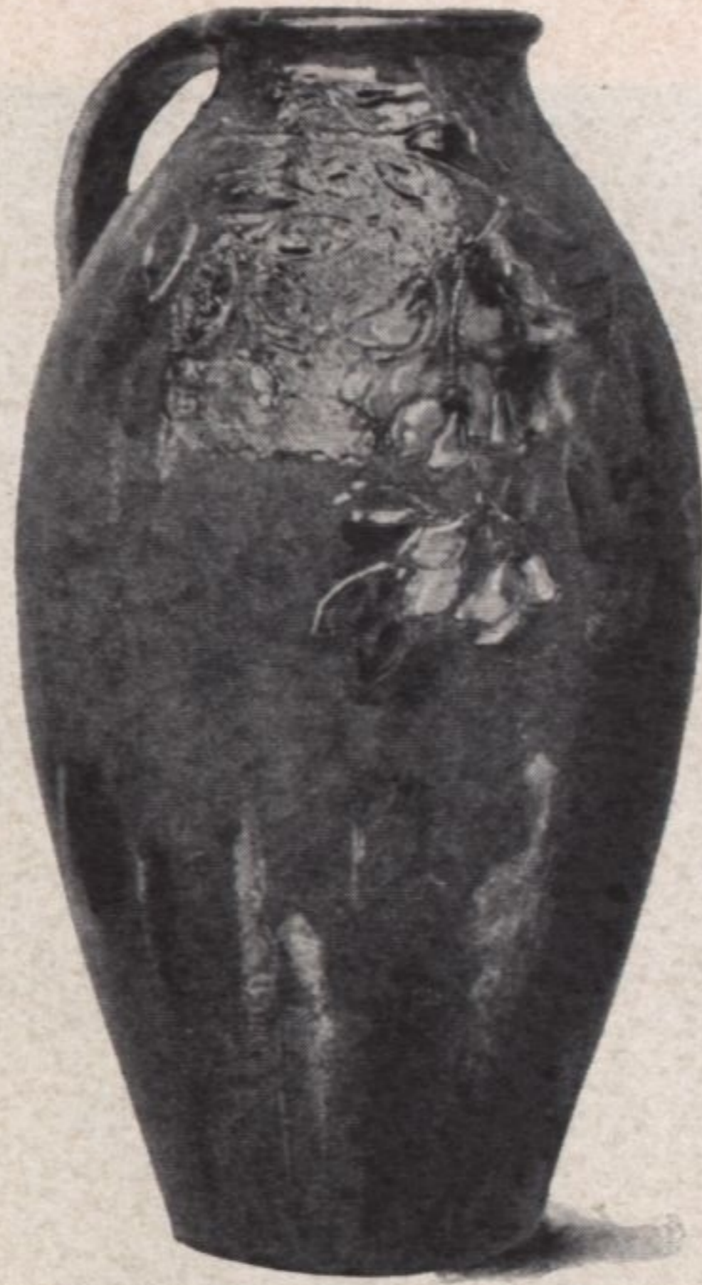
Henkelkrug, Fayence, aus der k. k. Fachschule in Teplitz