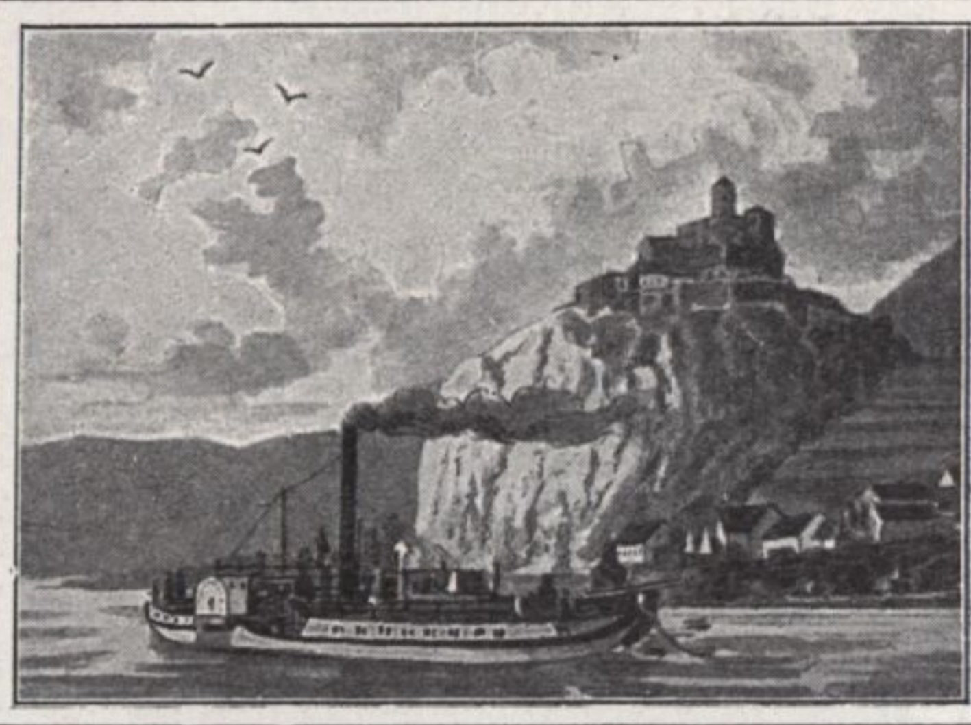
SCHRECKENSTEIN A/D ELBE