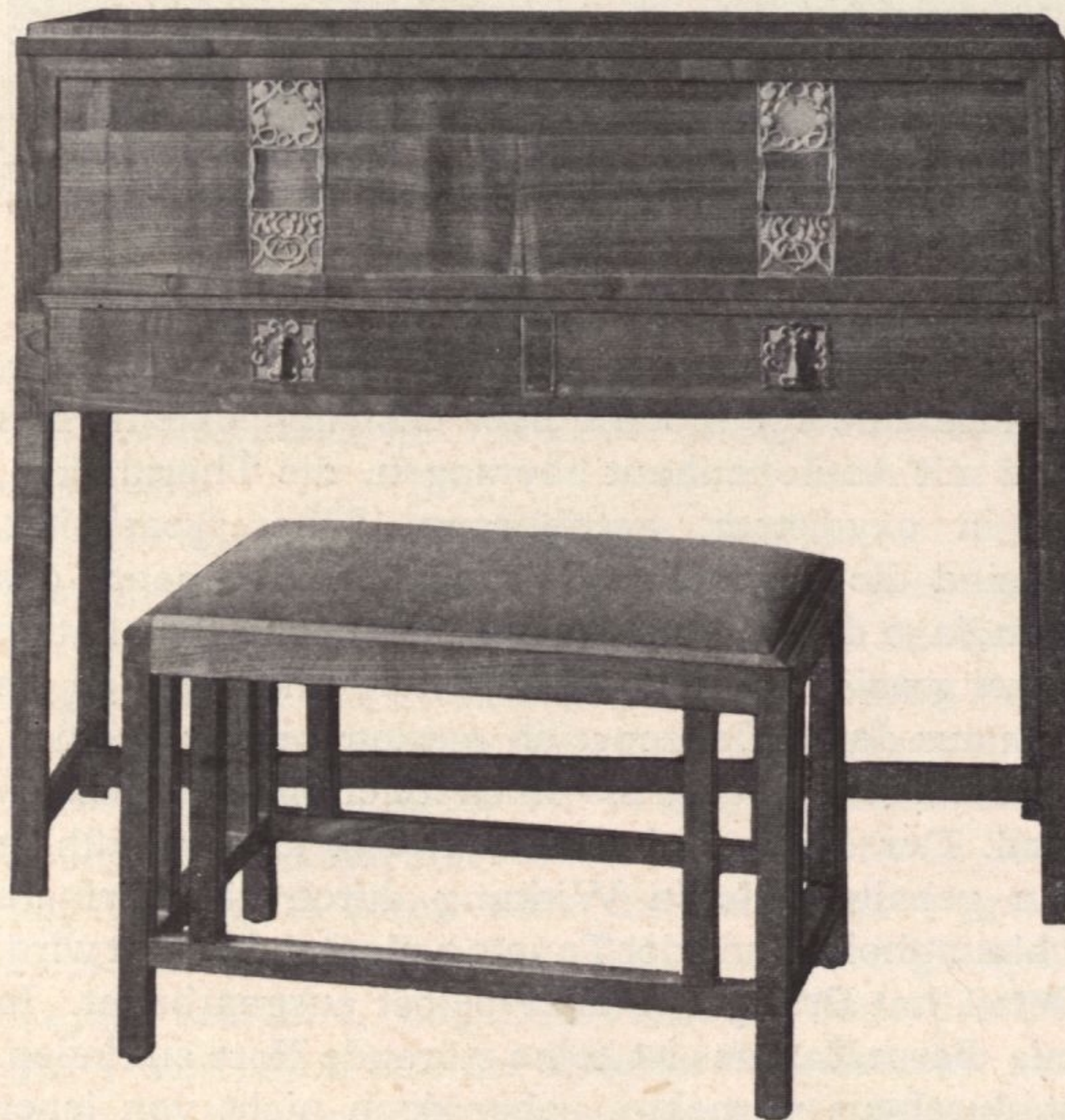
Frank Brangwyn, Secretär und Stuhl aus Kirschbaumholz

Von Brangwyn ist, trotz des hohen künstlerischen Wertes seiner bisherigen Schöpfungen, noch Vieles und Grösseres in der Zukunft zu erwarten. Er trägt den Keim zum Fortschritt in sich. In Alles, was er schafft, legt er