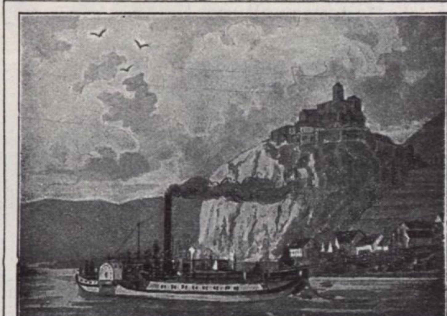
SCHRECKENSTEIN A/D ELBE