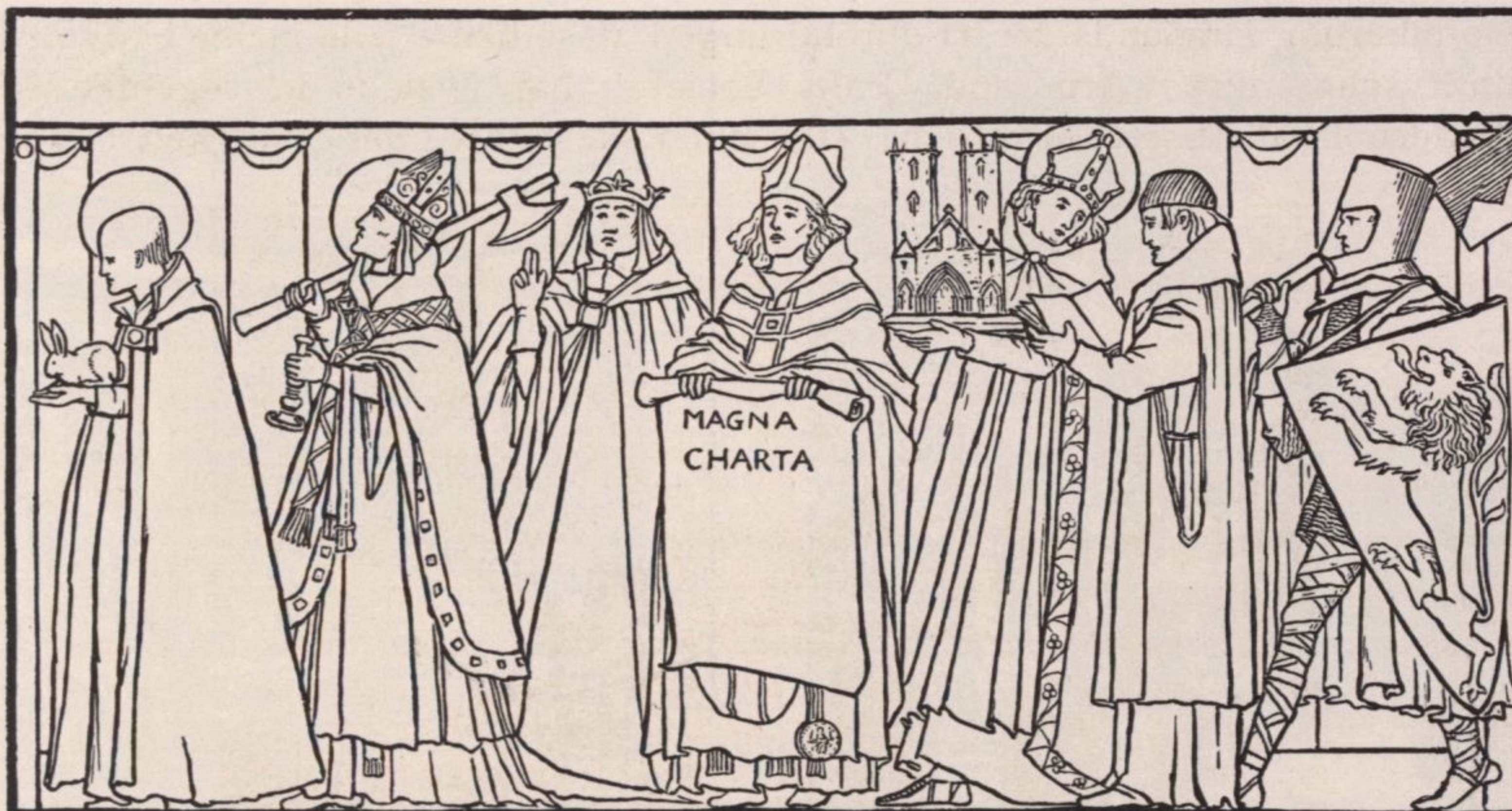
Guild of Handicraft, Kopfleiste v. C. R. Ashbee für das Gebetbuch Eduard VII.

älterem Stilproben erdrückt, und bei Liberty sind derartig extreme Gegenstände zu sehen, dass der Name auf dem Kontinent und speziell in Italien ein Beiwort geworden ist, um alle möglichen modernen Geschmacksverirrungen zu bezeichnen. Man weiss welcher Art die Sachen sind, welche zum Beispiel bei der Turiner Ausstellung unter dem Namen „lo stile Liberty“ zusammengefasst wurden.