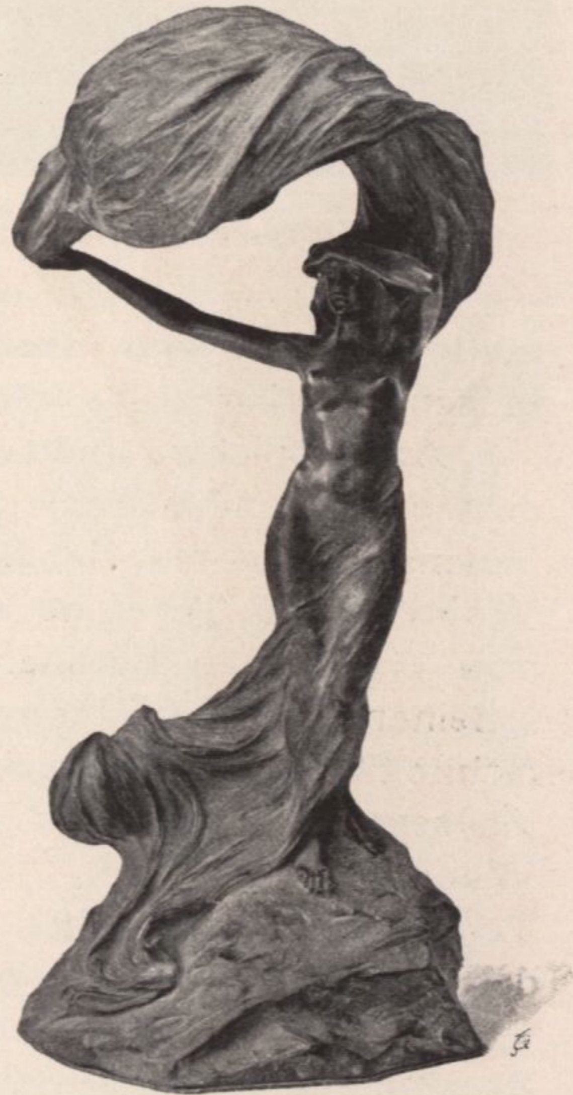
Lampe, Bronze, Entwurf von Franz Sautner, ausgeführt von Heinrich Hirschler