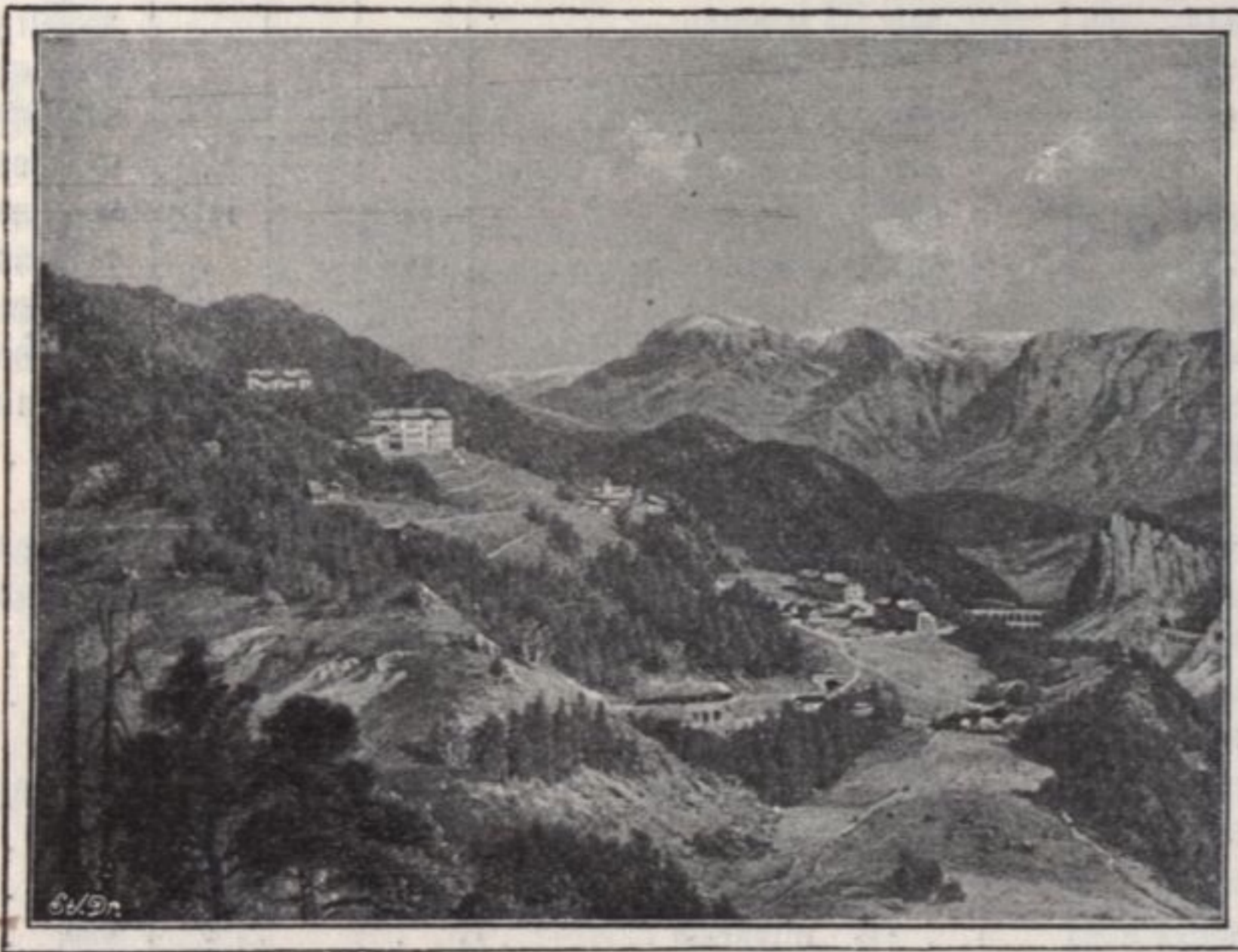
• SEMMERING •