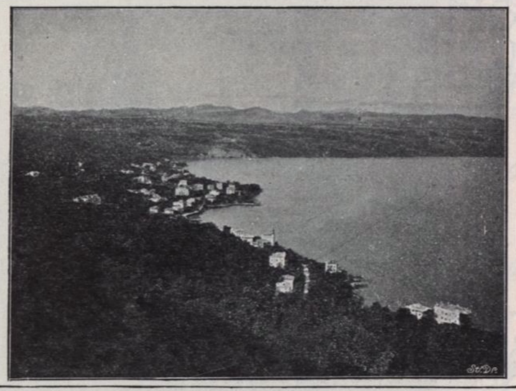
• ABBAZIA •