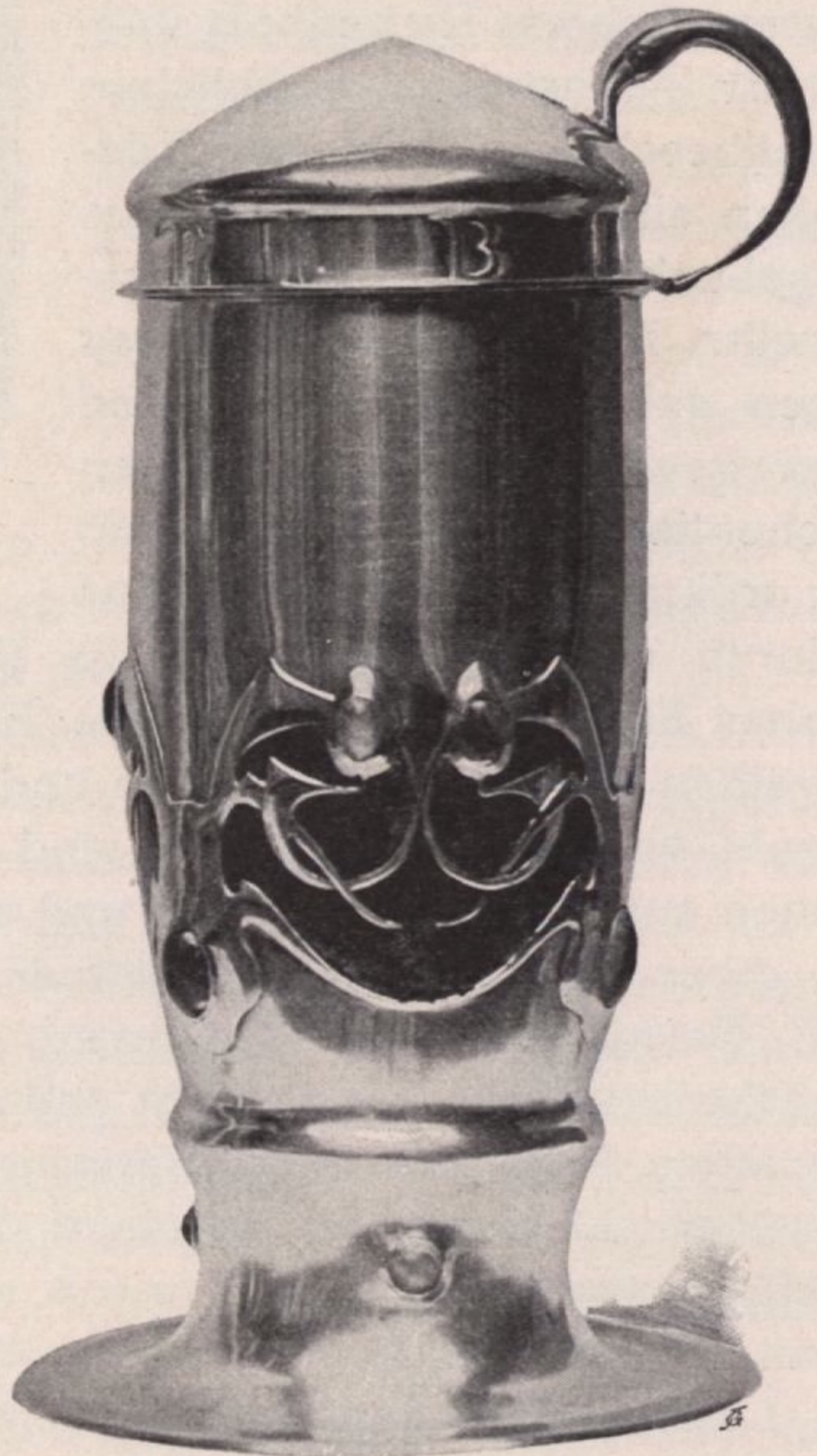
Arts & Crafts Ausstellung in London, emailierter Silberbecher mit Opalen, entworfen von Knox, ausgeführt von Liberty & Co.