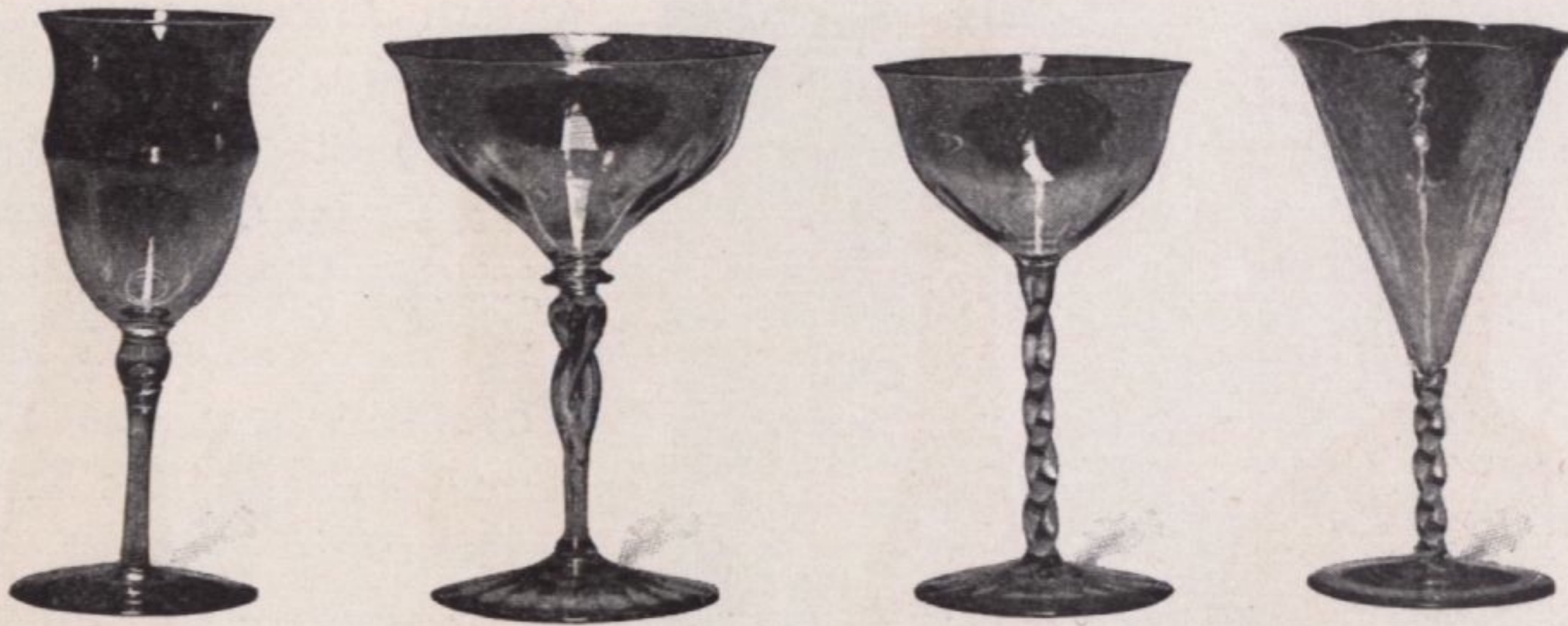
Arts & Crafts Ausstellung in London, Trinkgläser, von J. Powell & Sons