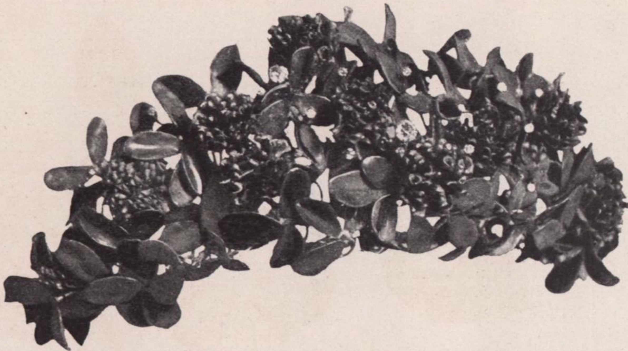
Weltausstellung zu St. Louis, Diadem, gehämmertes Gold mit Email, Silber und Diamanten, Louis C. Tiffany, New-York

gebiete mit dieser Ausstellung erreicht hat — das Kunstgewerbe offiziell in die grosse Kunstausstellung einbezogen. Dies ist bei einer Weltausstellung zum erstenmal in Amerika geschehen, mit gutem Erfolg, der hoffentlich dazu führen wird, dass wir Ausstellungen in der Art der „Salons“ erreichen und das Kunstgewerbe nicht mehr bei Seite geschoben wird. Nicht bloss die Firma stellt aus — vom industriellen Standpunkt aus — sondern auch der einzelne Künstler mit Namen. Das war hierzulande noch niemals da!