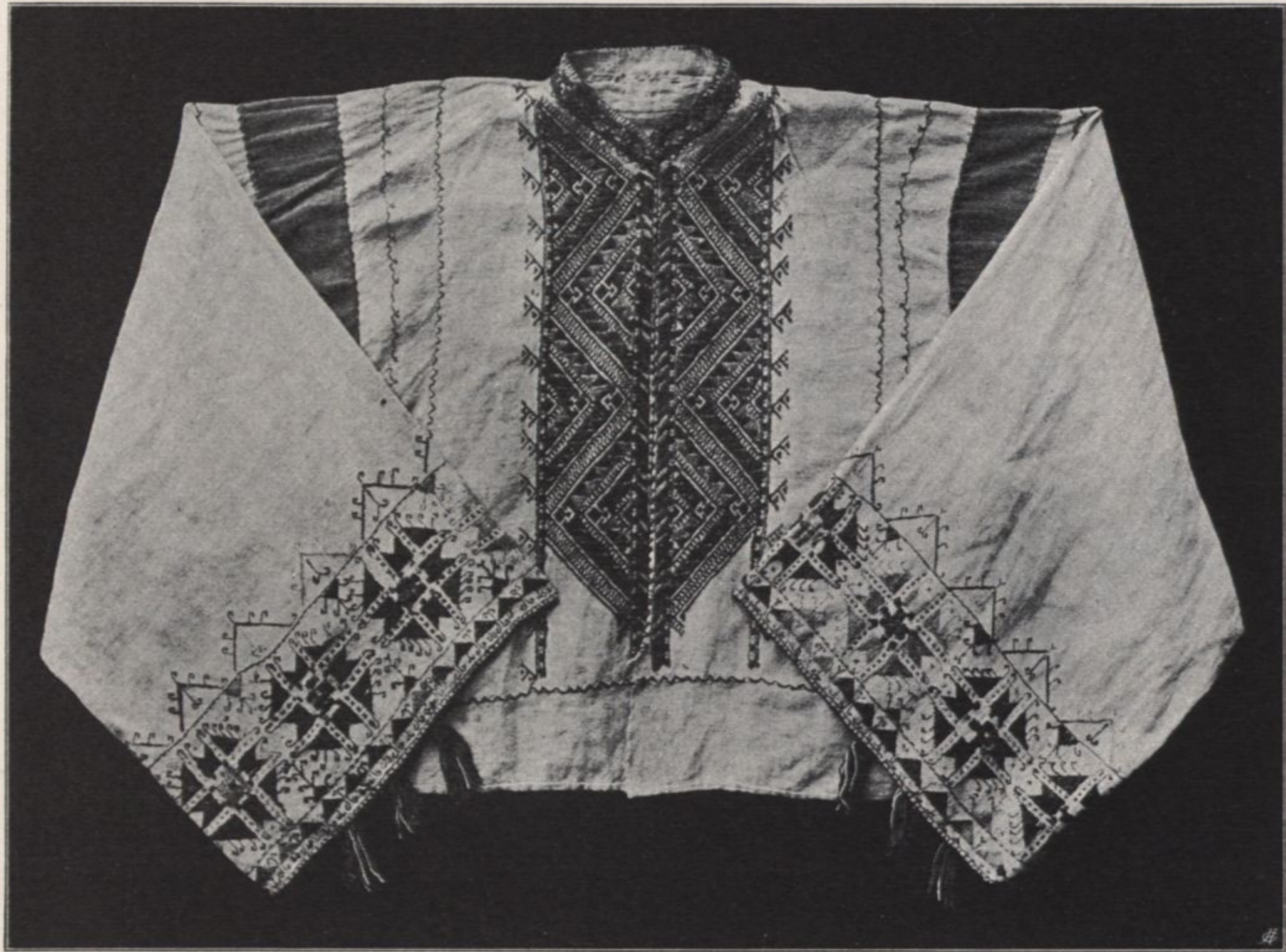
Hemd, Leinen, mit Seide gestickt, aus Preko, Dalmatien (Kat. XV, 93)