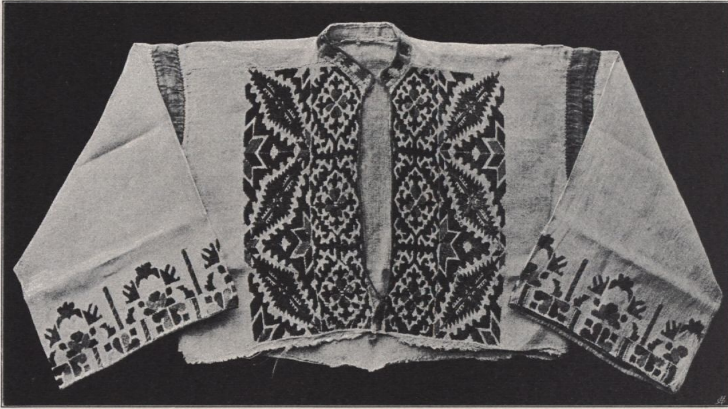
Hemd, gestickt, XVIII. Jahrhundert, aus Preko, Dalmatien (Kat. XV, 11)