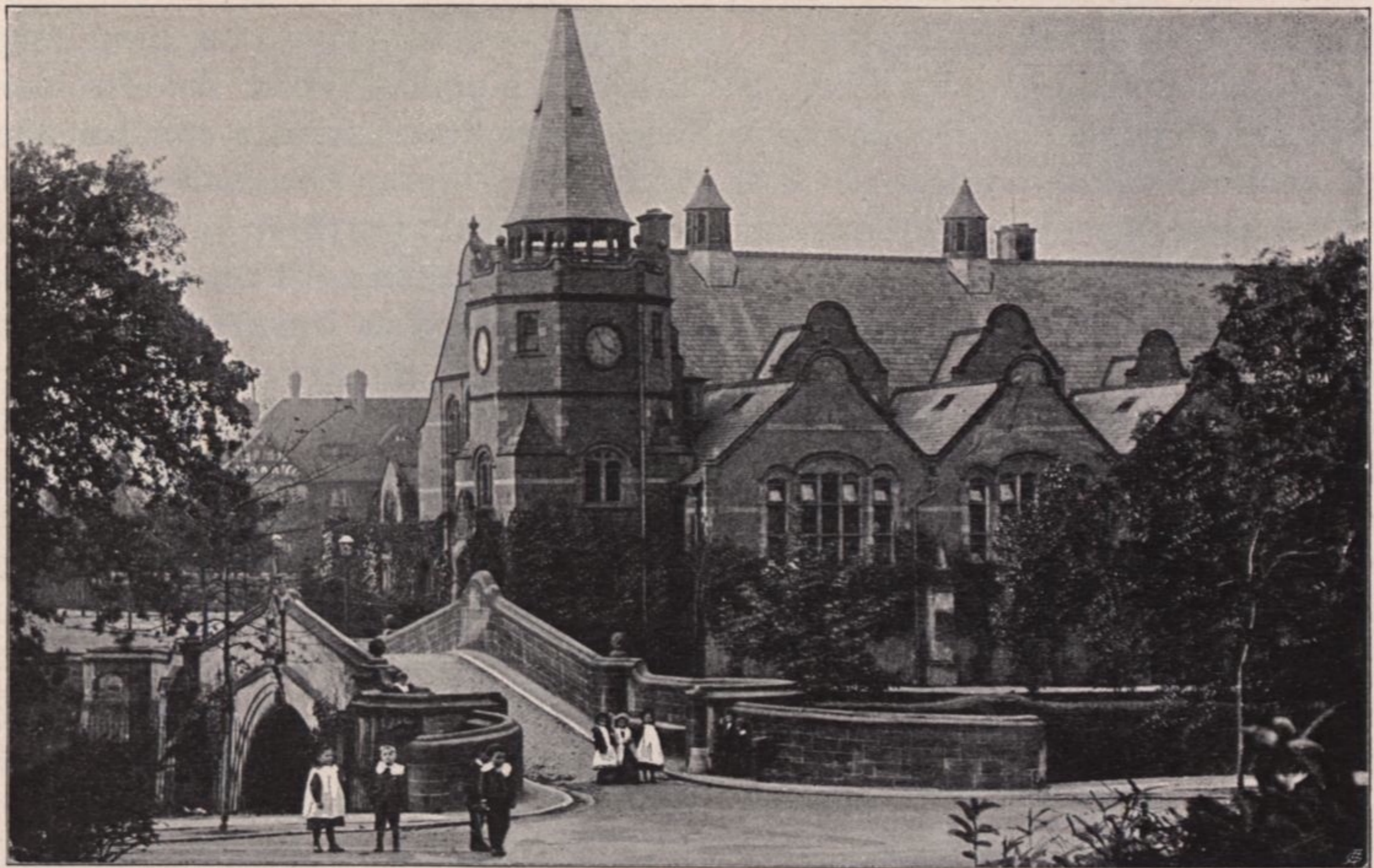
Abb. 25. Port Sunlight, Schulhaus in Park Road, Douglas und Fordham, Architekten

Bassin einen Längsdurchmesser von etwas über 30 Meter, einen Querdurchmesser von 23 Meter hat. Rings um dasselbe gruppieren sich Ankleidezellen, Räume mit Duscheapparaten und so weiter, beschattet von breit-