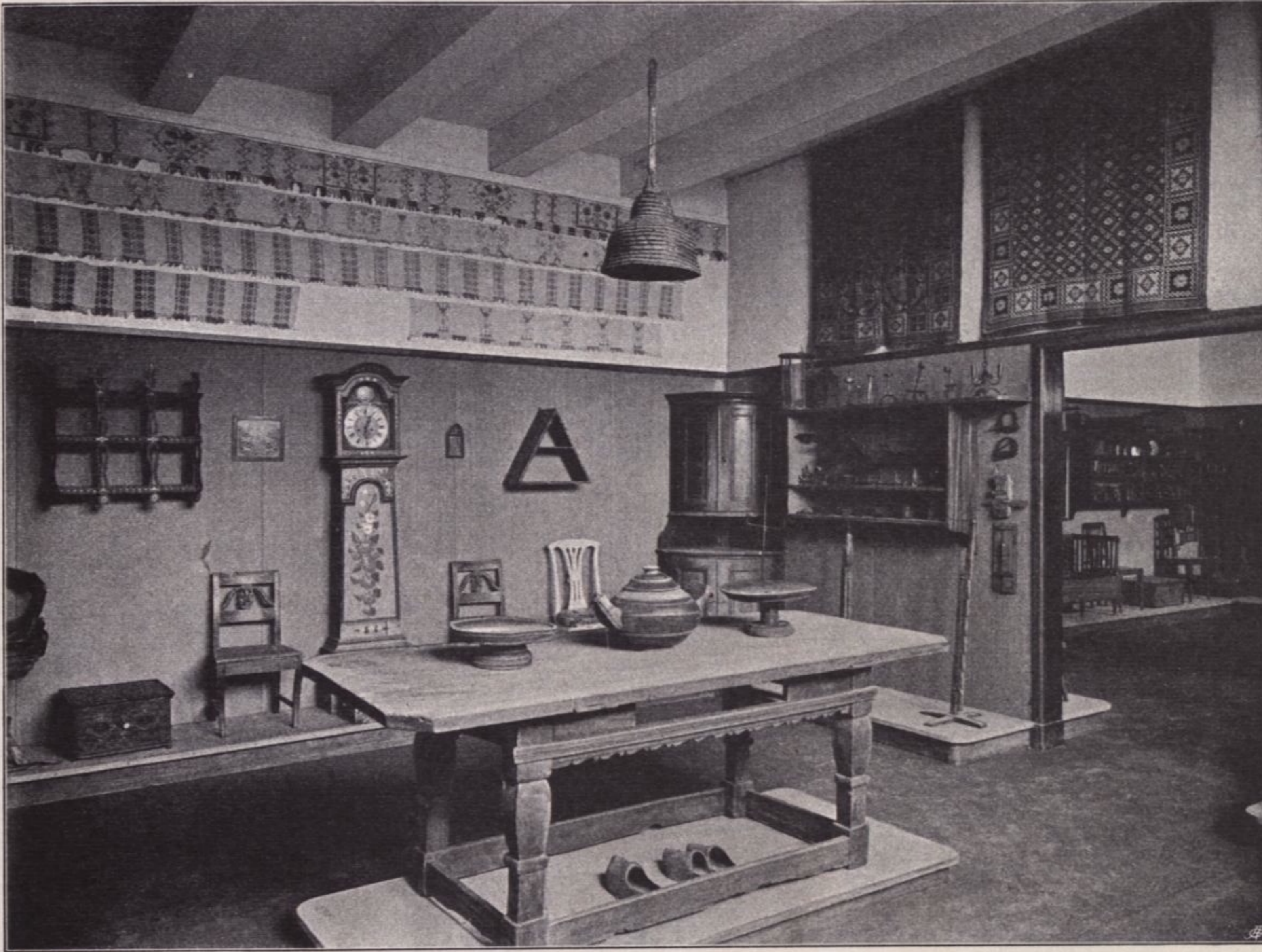
Aus dem Nordischen Museum in Stockholm