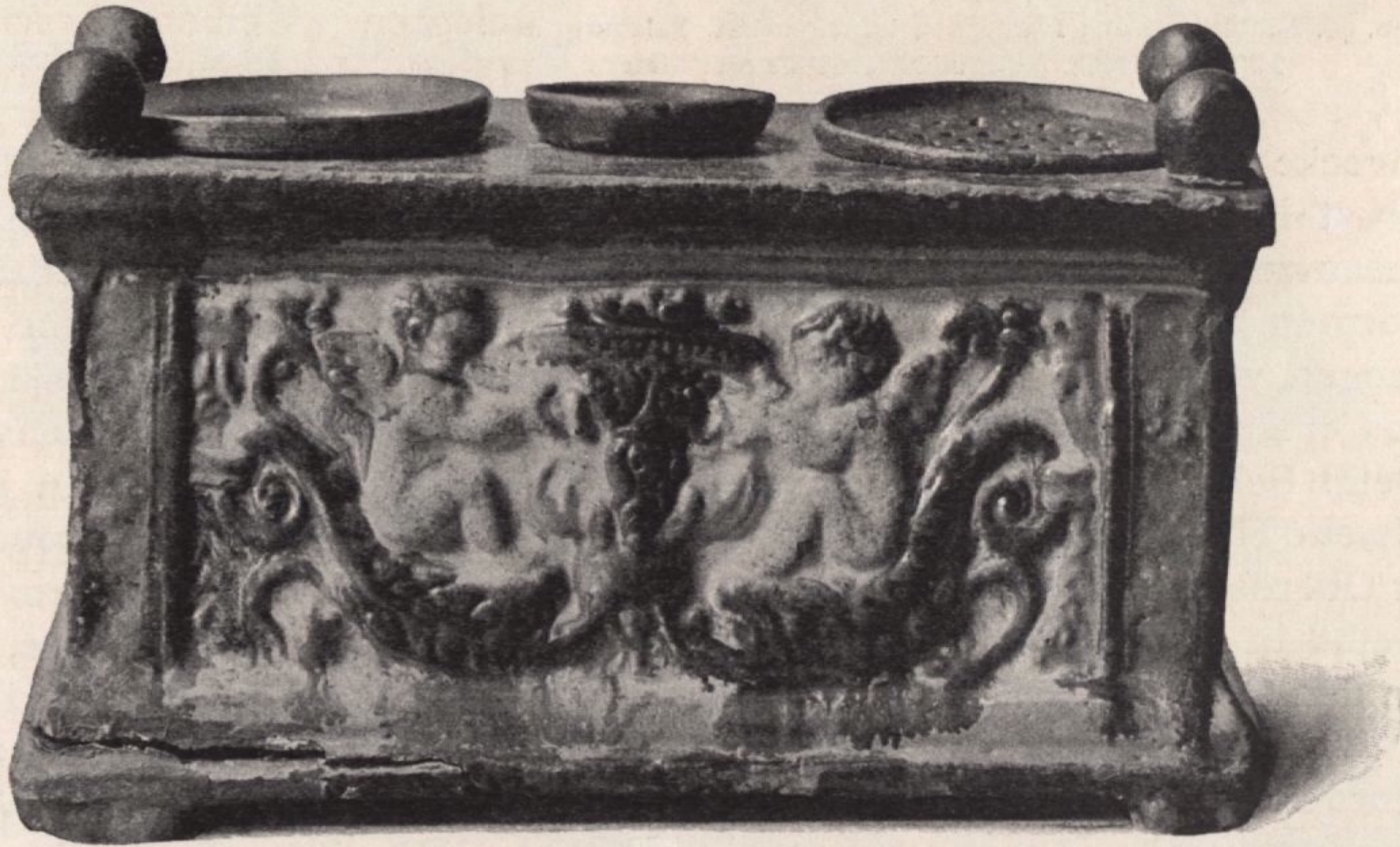
Abb. 45. Schreibzeug aus Hafnerton, bunt glasiert. Oberösterreich oder Salzburg. XVI. Jahrhundert, zweite Hälfte. Breite 0,13 Meter

Pranken hält (Abb. 41), sowie einer durchbrochen gearbeiteten Feldflasche (Abb. 42), beides Nürnberger Arbeiten, umfaßt die Sammlung Figdor noch eine große Anzahl von Keramiken aller Art, wie Schüsseln, Tintenzeuge,