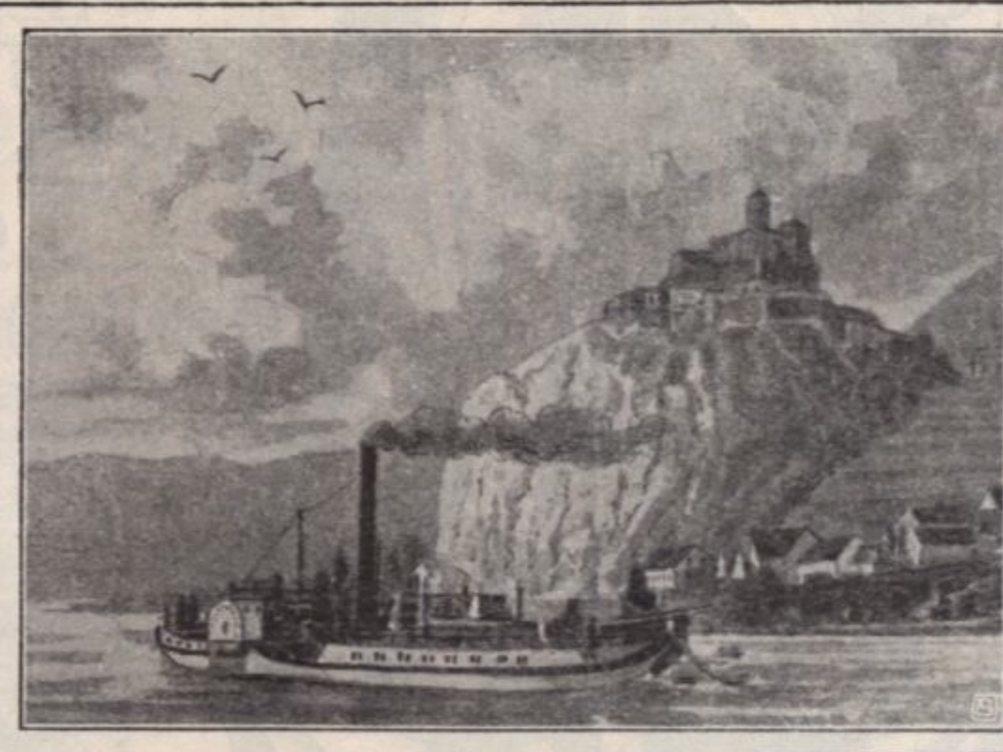
SCHRECKENSTEIN A/D ELBE