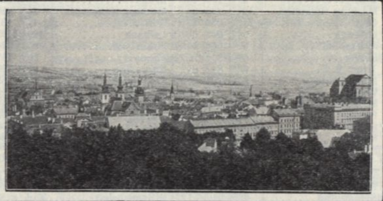
• TROPPAV •