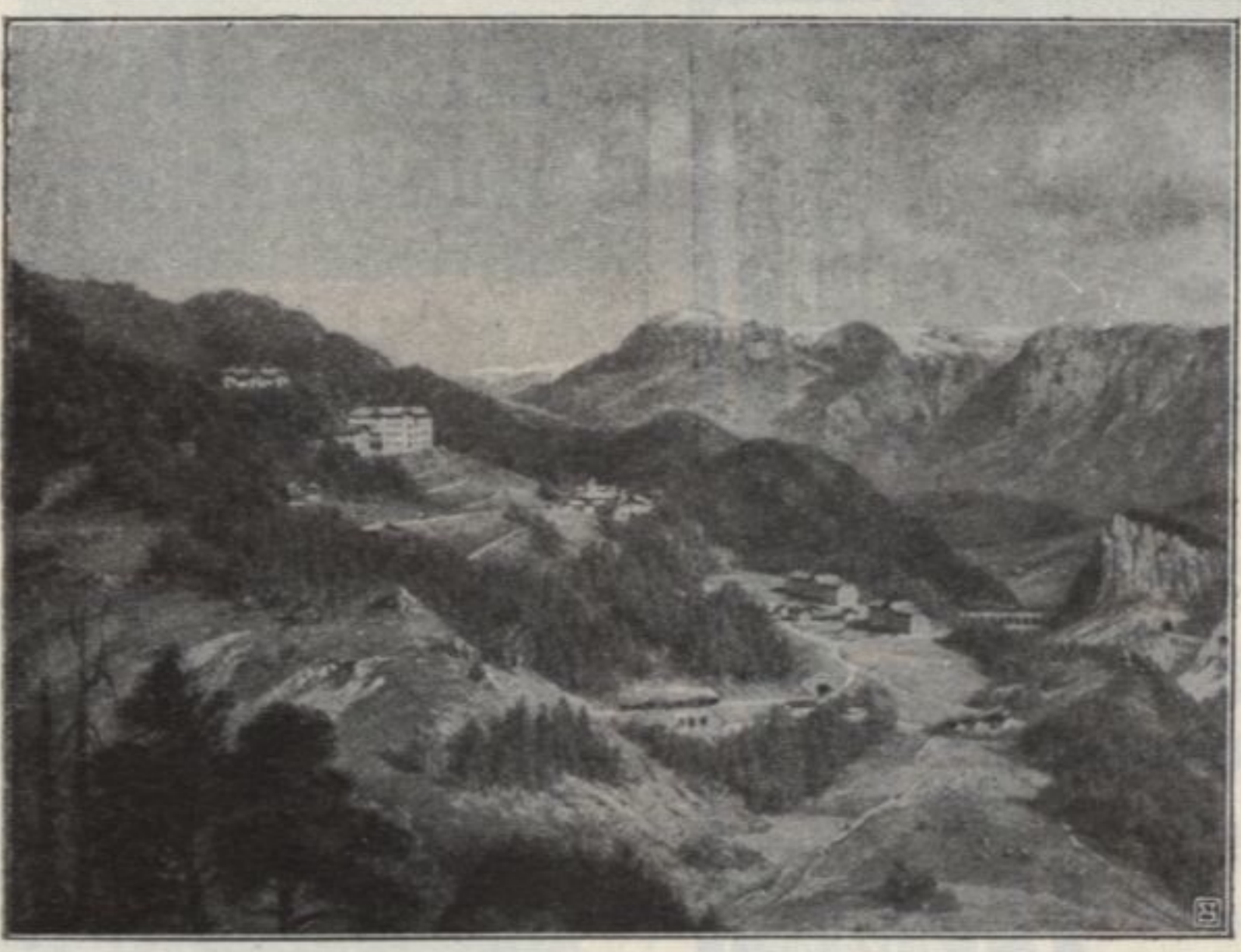
• SEMMERING •