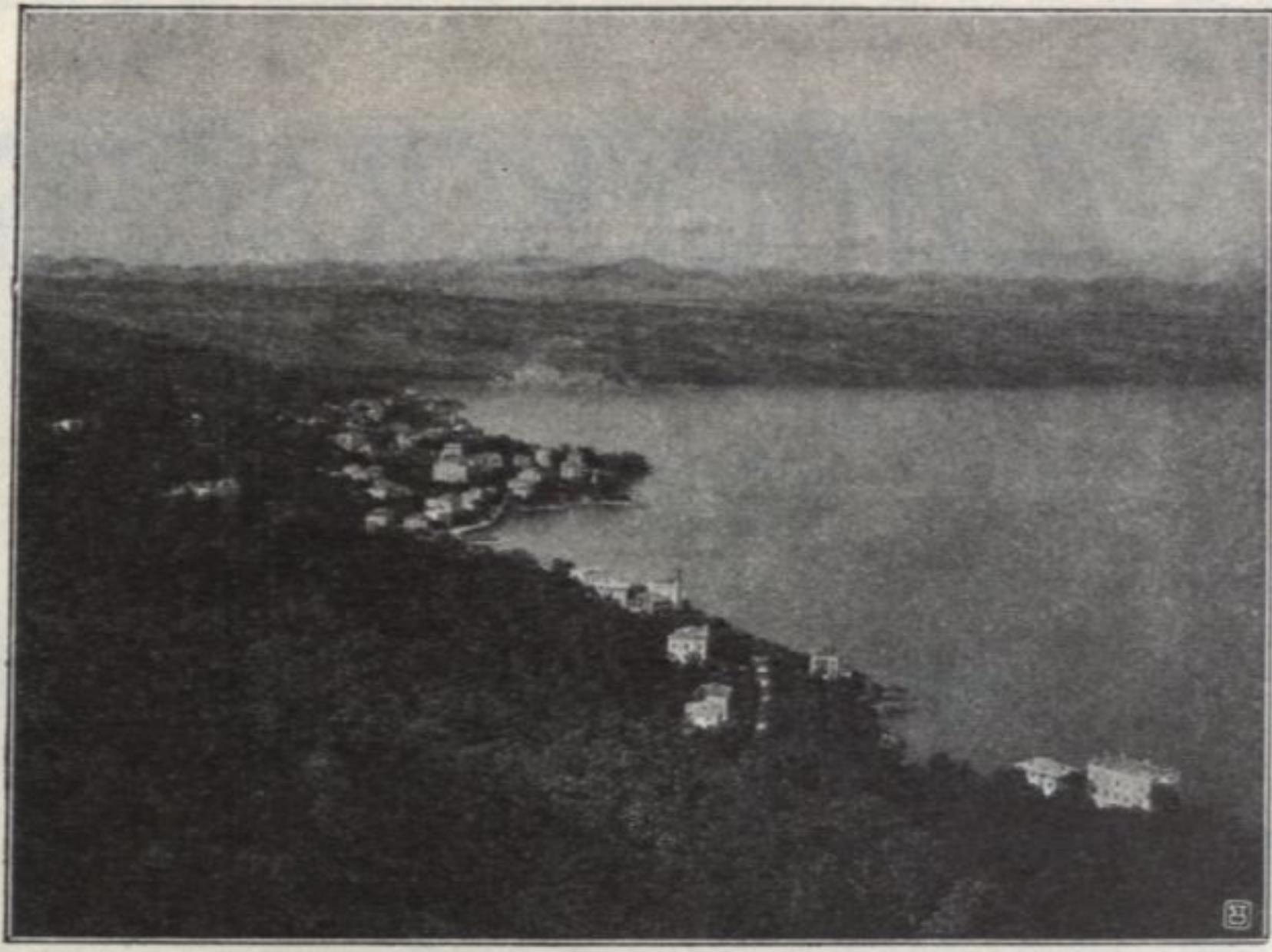
• ABBAZIA •