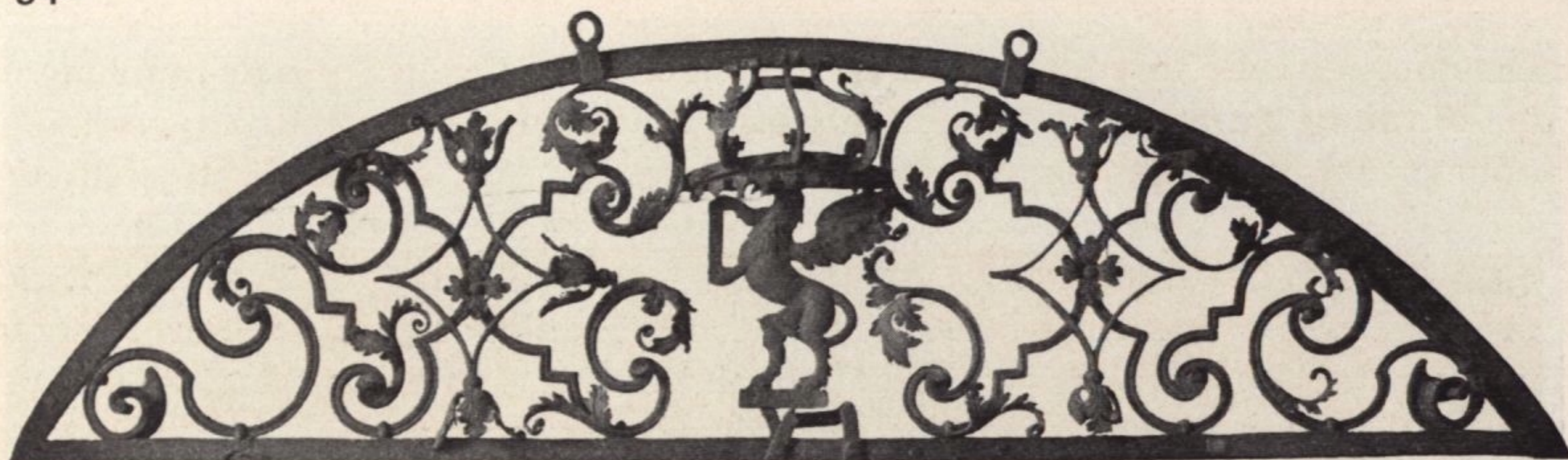
Oberlichtgitter, Schmiedeeisen, Brünn, XVIII. Jahrhundert (Erzherzog Rainer-Museum, Brünn)

licher Kunstwerke und zusammenhängender Spezialsammlungen ist heute die immer mehr in den Vordergrund tretende Aufgabe der Landes- und Provinzialsammlungen. Ihr dient der erfolgreiche Zusammenschluß der