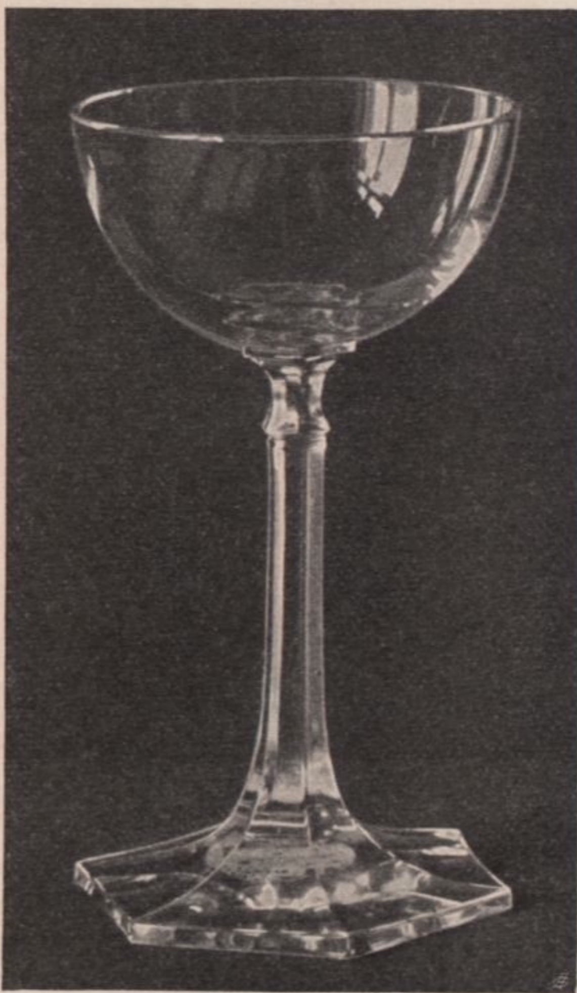
Ausstellung österreichischen Kunst- und Exportglases im Österreichischen Museum. J. & L. Lobmeyr, Weinglas