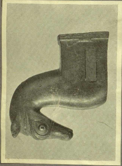
Nr. 56 PFERDEKOPF AUS BRONZE. China, T'ang- bis Sungzeit.