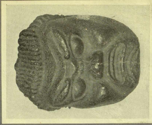
Nr. 54 MASKE AUS STEIN. China, T'ang- bis Sungzeit.