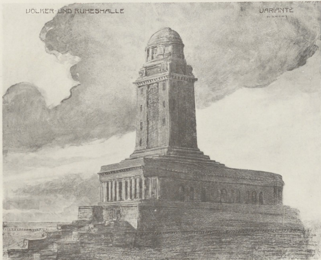
Nr. 24. Variante.