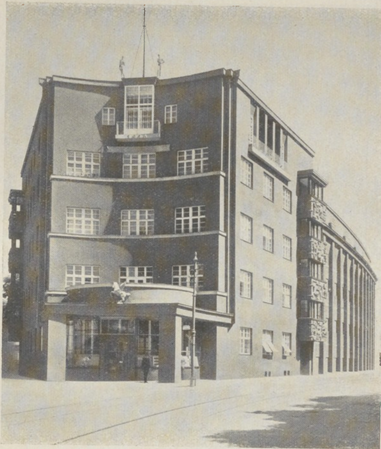
Blick gegen die Hauptfassade.