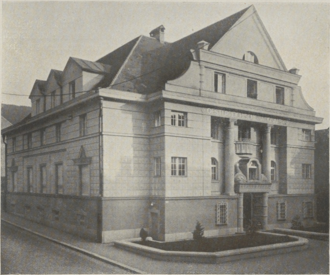
Zweigstelle Bregenz der Österreichischen Nationalbank.