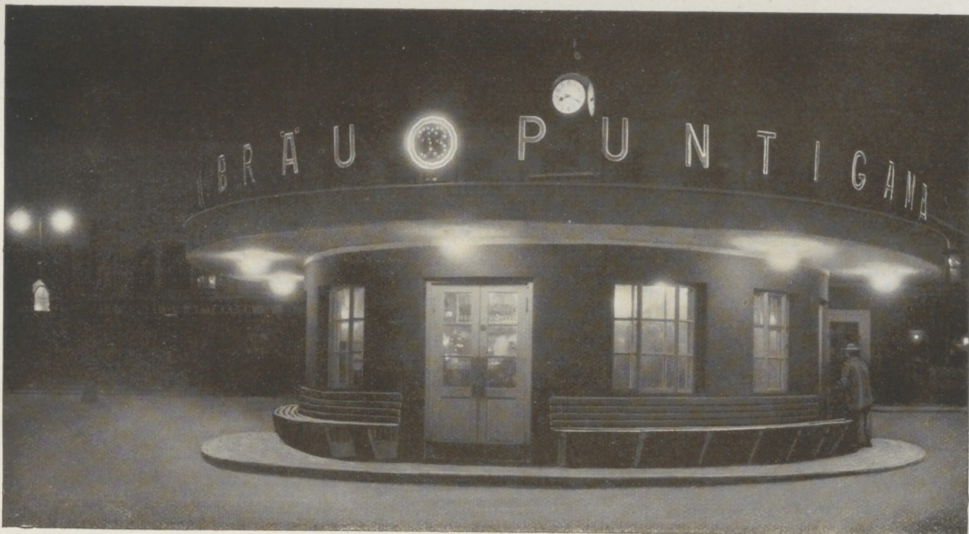
Pavillon am Jakominiplatz in Graz.