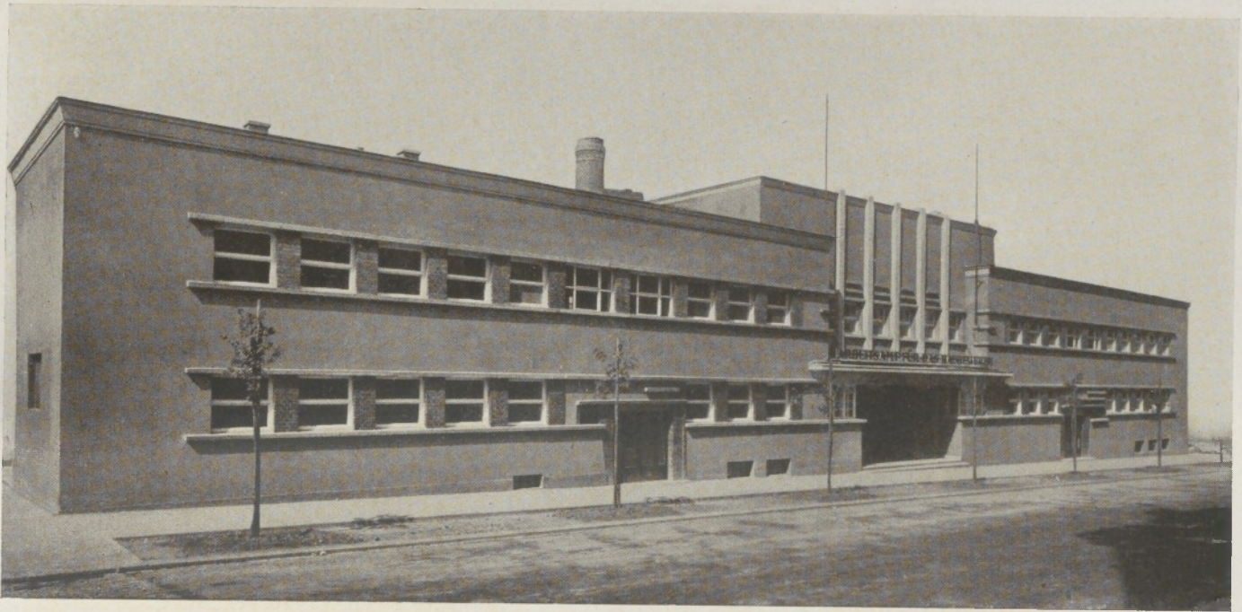
Arbeitsamt für das Baugewerbe, Wien XVI. Ansicht Herbststraße.