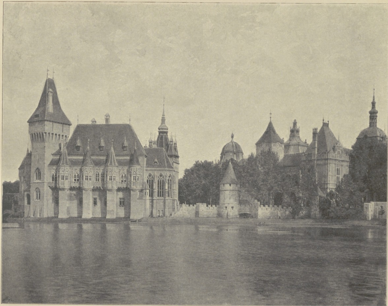
Gruppe der Gothik und Renaissance.