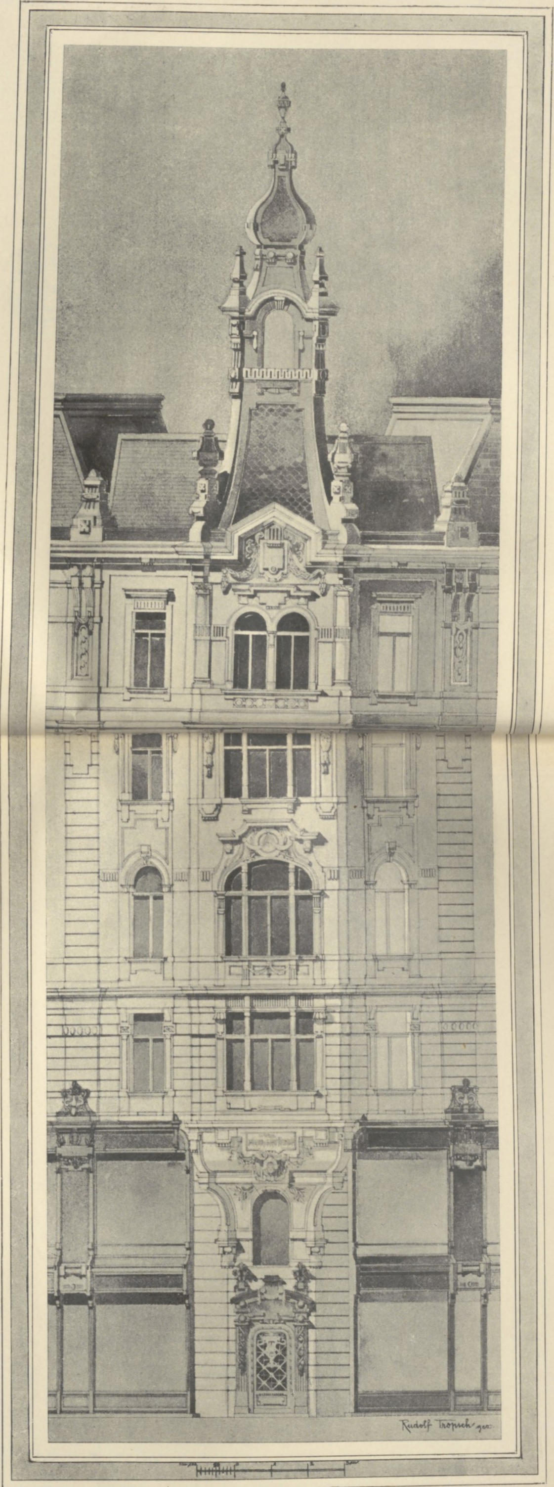
Ecke Bauernmarkt und Freisingergasse.