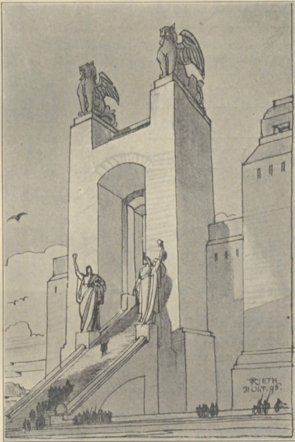
Aus O. Rieth Skizzen, Folge IV.

In zwanglosen Folgen erscheinend. Bisher vorliegend: