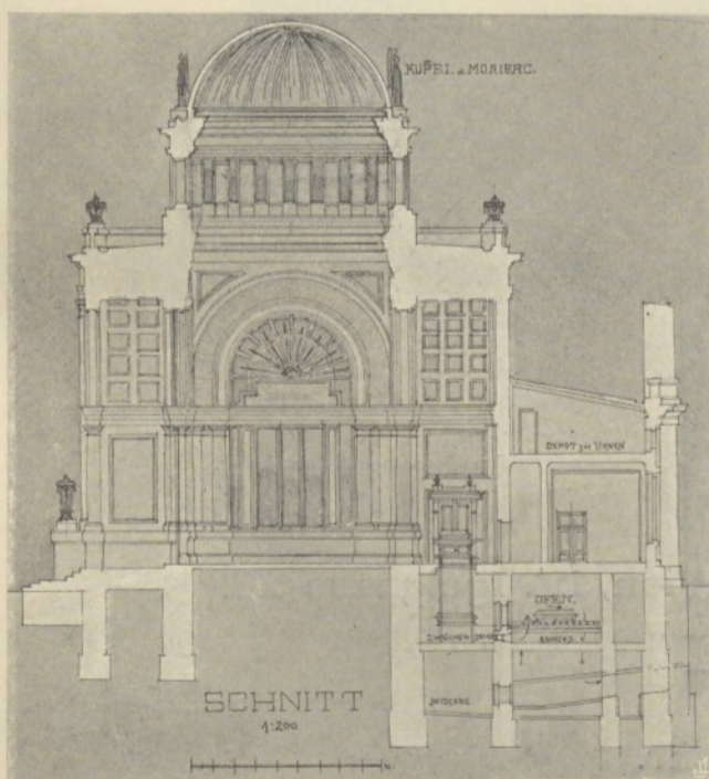
IV. Preis. Schnitt.