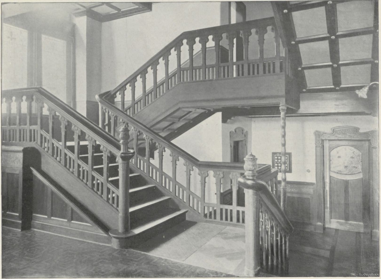
Villa in München. Treppenanlage.