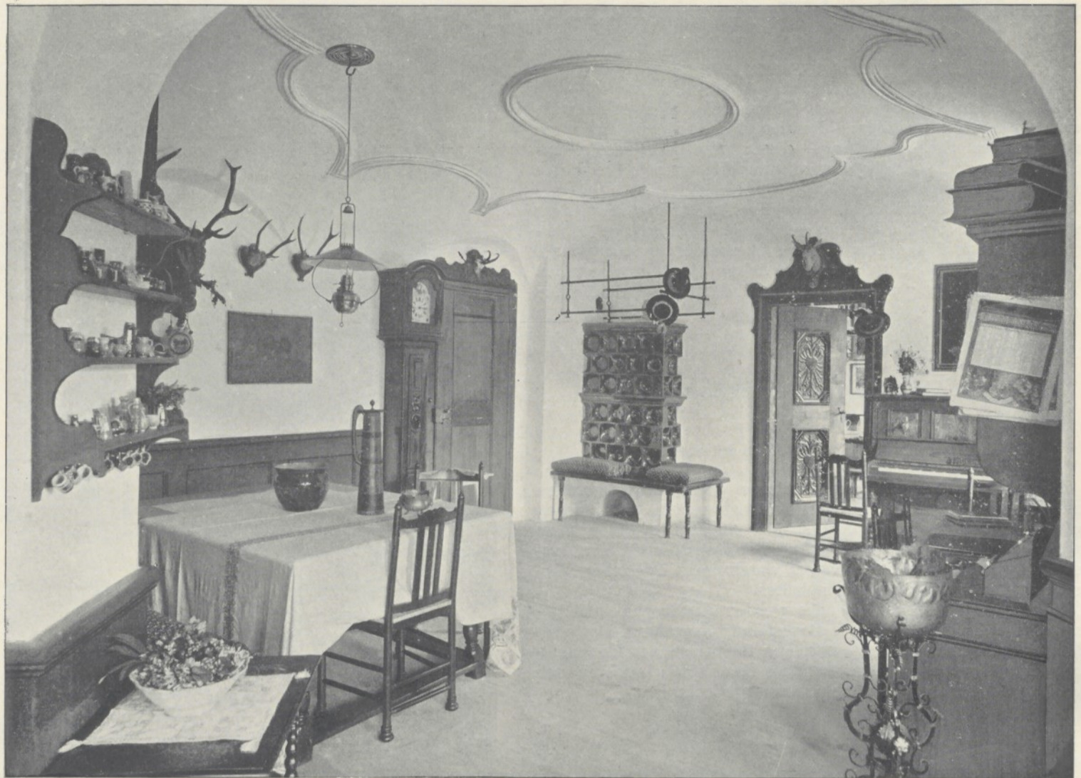
Innenraum aus der Villa v. Schön in Berchtesgaden.