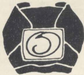
MONOGRAMM J. O. AM COUVERT PAPIER OLBRICH.

Dieses Werkchen bildet die erste Abtheilung des VII. Bandes der »Praktischen Unterrichtsbücher für Bautechniker« des bekannten Verfassers und gibt das über die Säulenordnungen Wissenswerthe in knappster Form, ohne das leichte Verständnis zu beeinträchtigen.