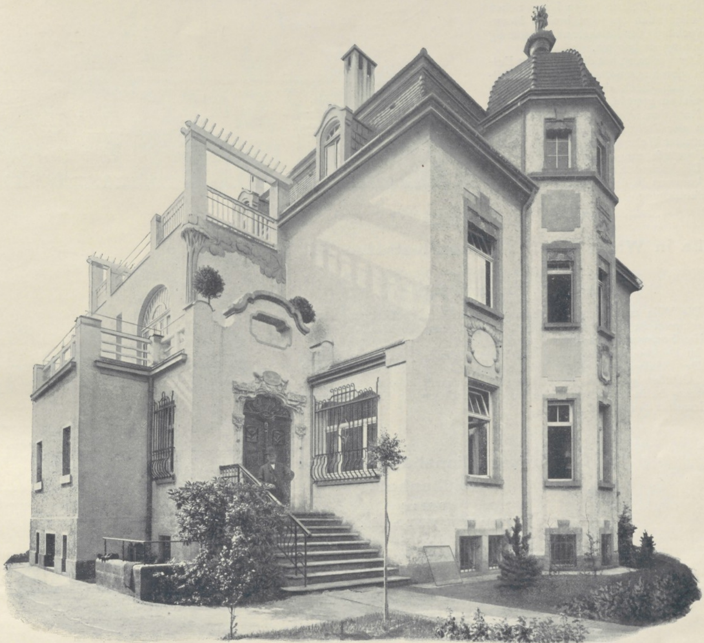
Villa Dr. Günsberg in Dresden.

Architekten Schilling &amp; Gräbner in Dresden.